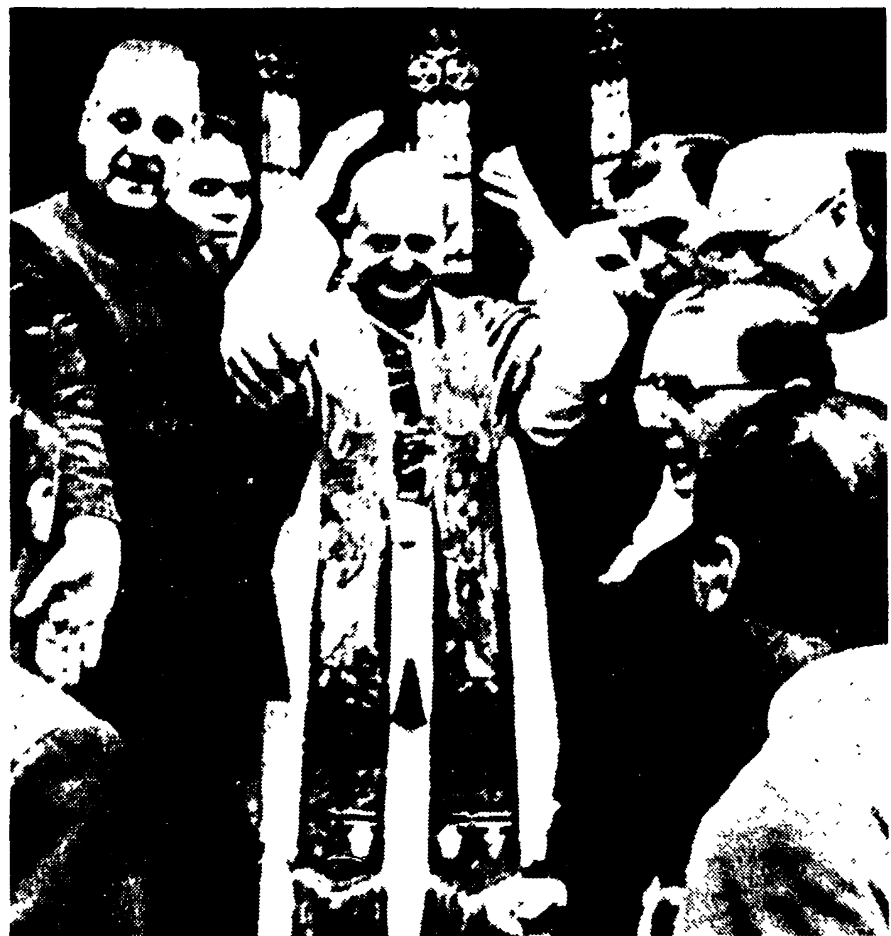
ISTANBUL — Paolo VI saluta la folla all'uscita dalla chiesa di Sant'Antonio

Nella seconda giornata ha avuto colloqui con il capo della chiesa armena e con dirigenti politici turchi - Discusso anche il problema del Medio Oriente - Primo bilancio delle due giornate