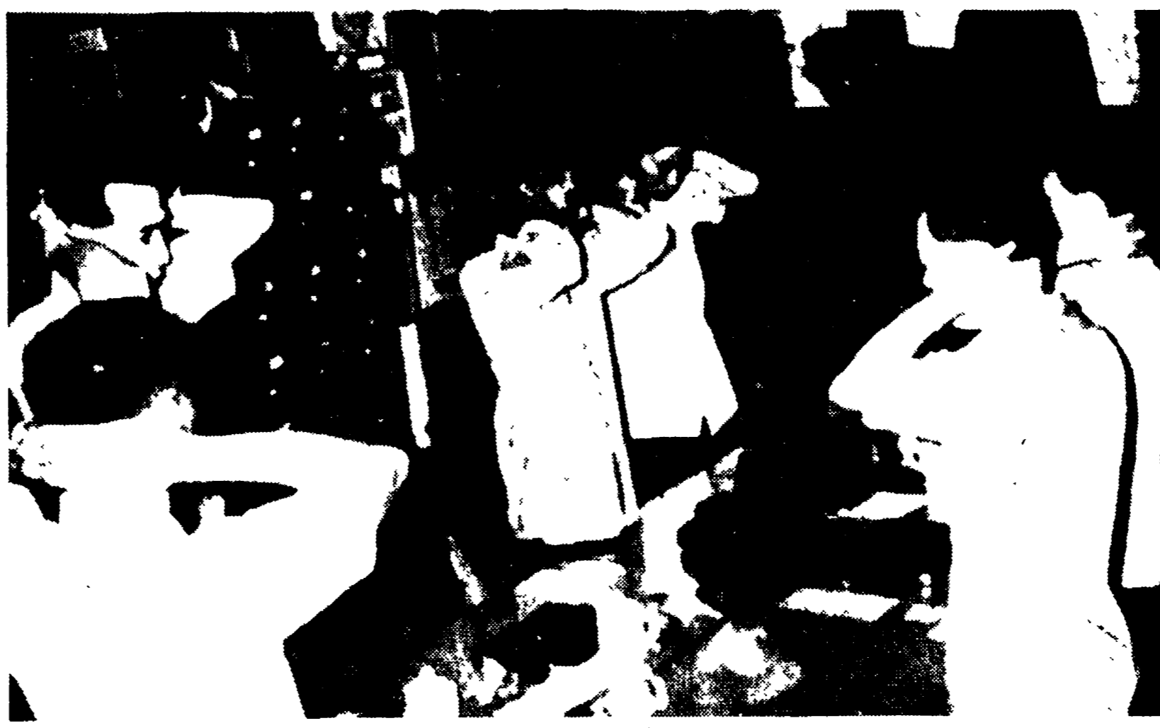
HONG KONG - Un agente di polizia sorveglia un gruppo di impiegati che sono scesi in sciopero tenendoli in piedi dietro le loro scrivanie con le mani dietro la nuca