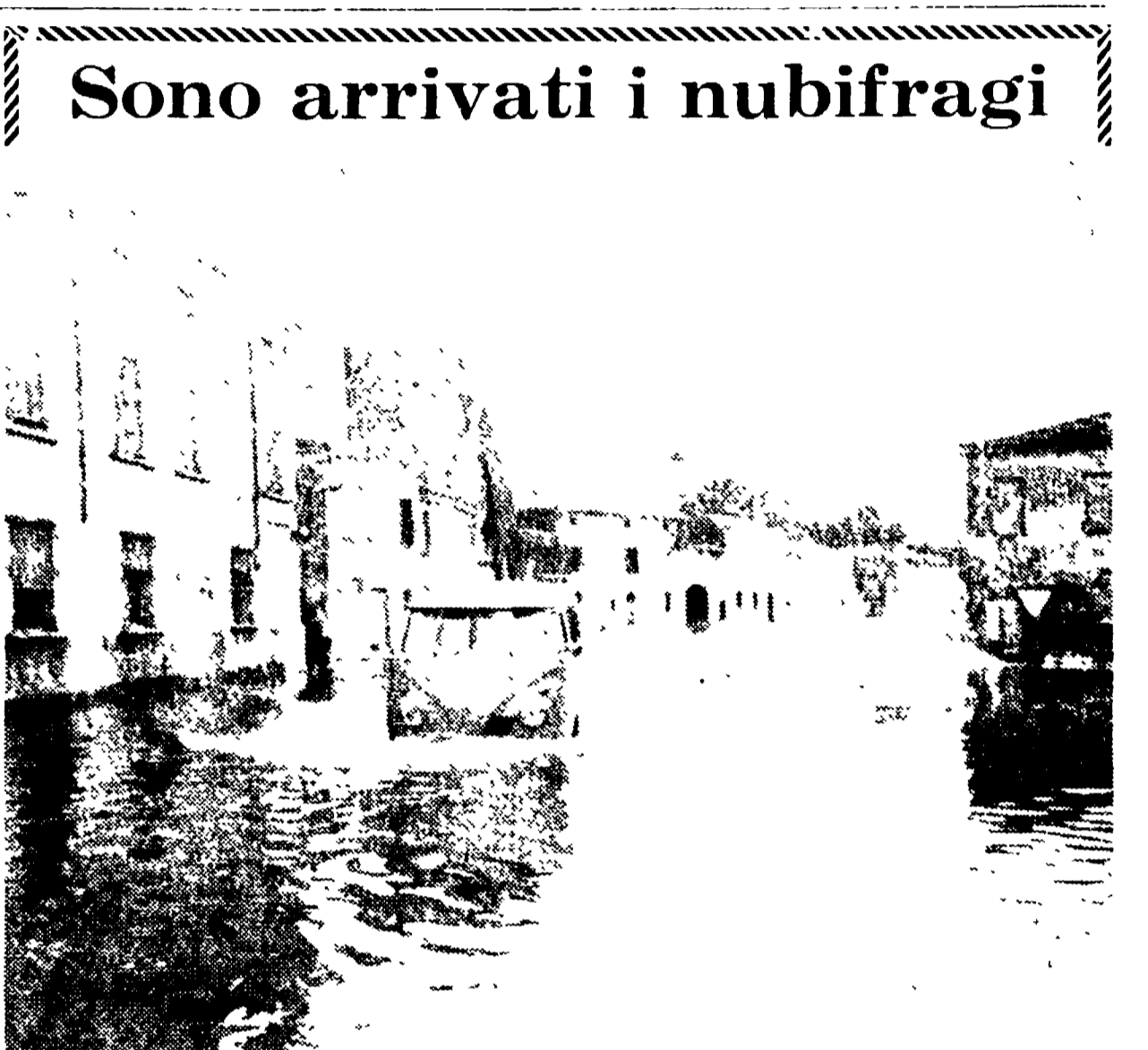
CERLONGO (Mantova) — Un violento nubifragio abbattutosi sul Mantovano ha allagato numerosi paesi: ecco una strada di Cerlongo invasa dall'acqua. (Teletext ANSA)

Per ore e ore una famiglia di braccianti sotto il terrore delle raffiche dei poliziotti e dei carabinieri - Circondato un intero rione perchè un milite aveva visto un'ombra - La versione ufficiale, secondo la quale il Mesina sarebbe riuscito a fuggire facendosi scudo col corpo della figlia del bracciante, smentita dalla ragazza - Amari commenti dei componenti una «troupe» televisiva danese.