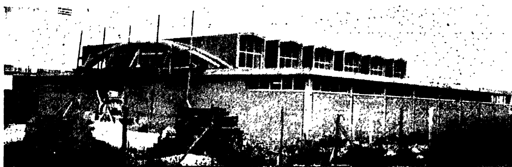
La nuova palestra per la scherma in via dei Pensieri