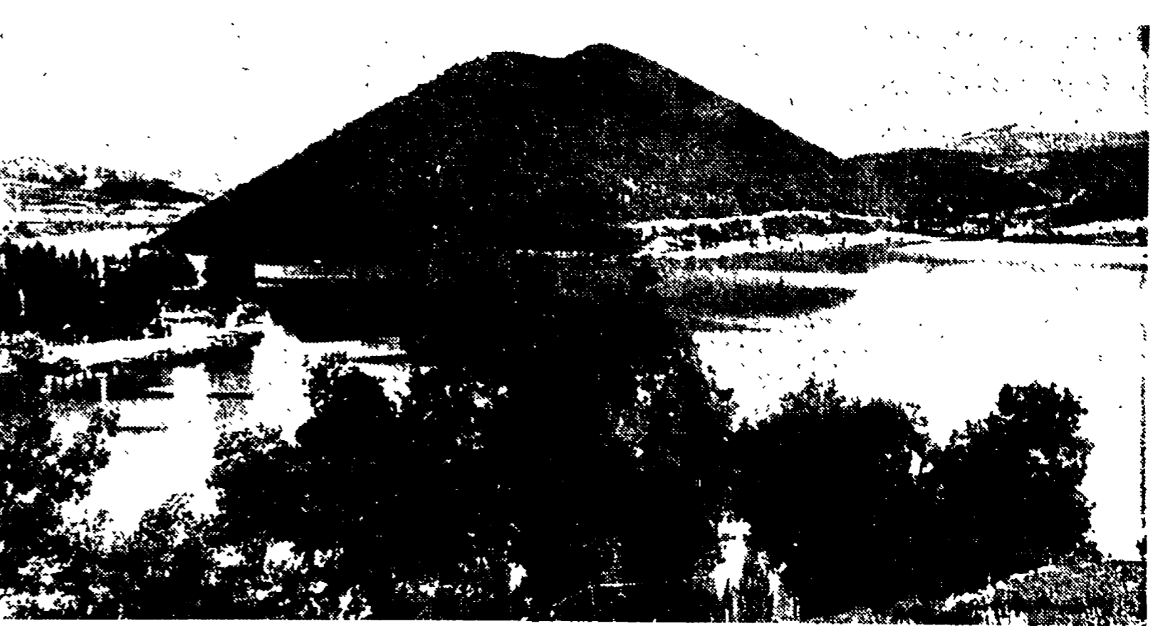
Una visione suggestiva di Piediluco