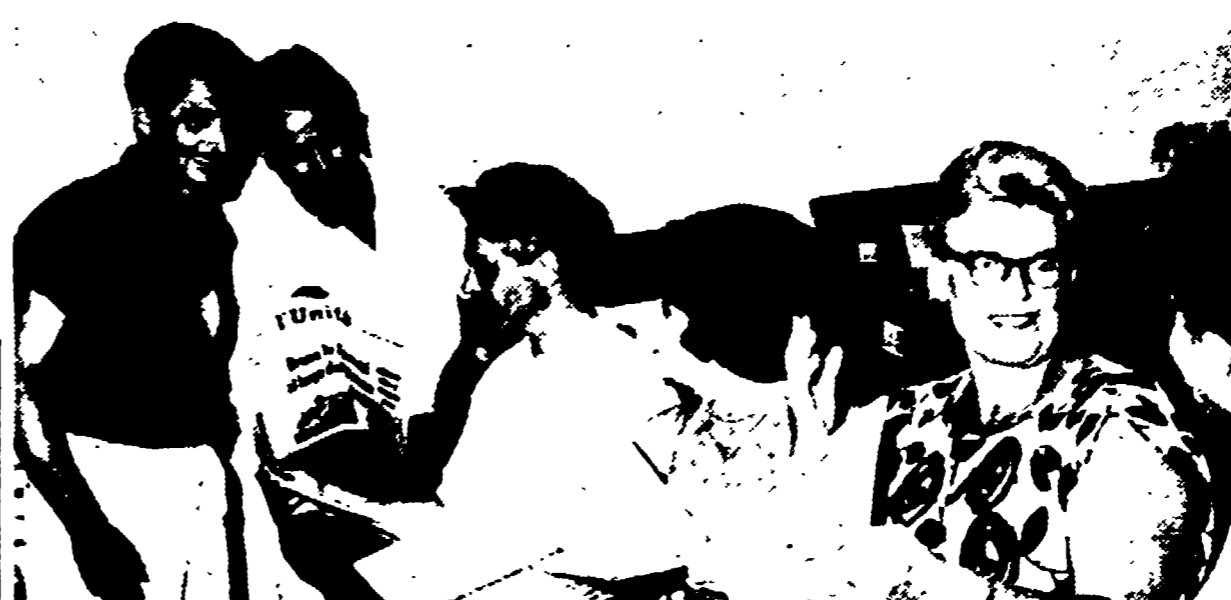
S. BENEDETTO DEL TRONTO - L'incontro con la squadra tennisistica sovietica al Festival

Interessanti iniziative in tutta la provincia - Numerose feste nella Lunigiana - Successo del Festival di S. Benedetto del Tronto