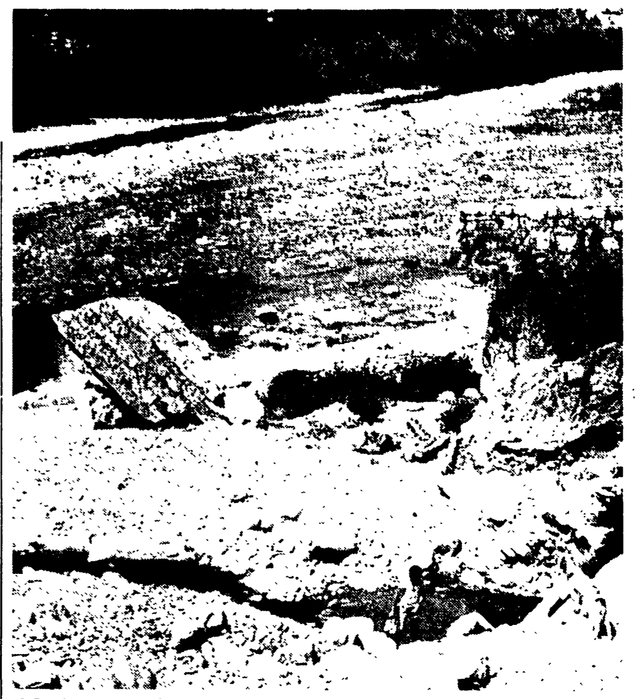
A Rassina, come si può vedere nella foto, enormi massi ingombrano il letto del fiume.

Nell'aretino l'Arno è ormai un'immensa pietraia - Dopo gli allagamenti il diluvio del Genio Civile e delle banche