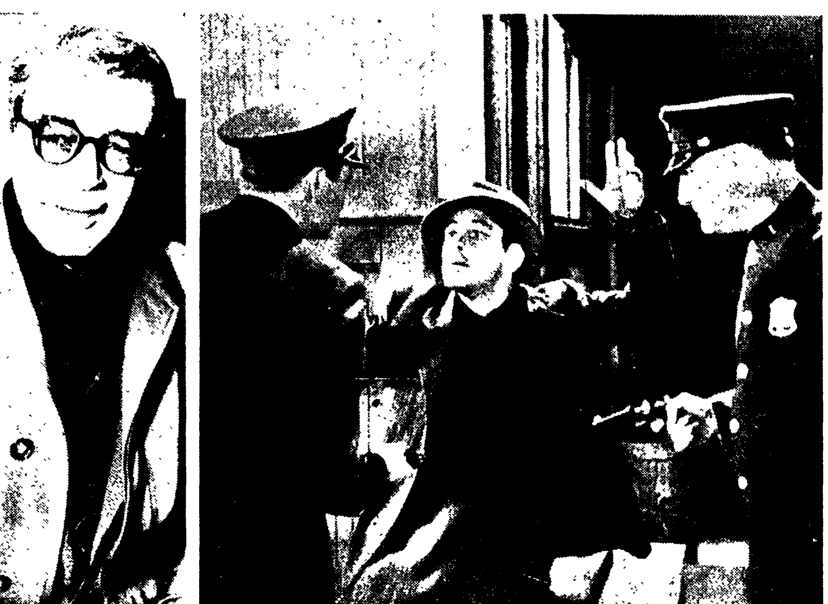
Paul Muni in una recente foto e nel film «Io sono un evaso»

Fu il gangster degli anni ruggenti - Altri suoi film: «La buona terra», «Io sono un evaso», «Il conquistatore del Messico» - Era nato a Leopoli - Un personaggio vero e un grande attore