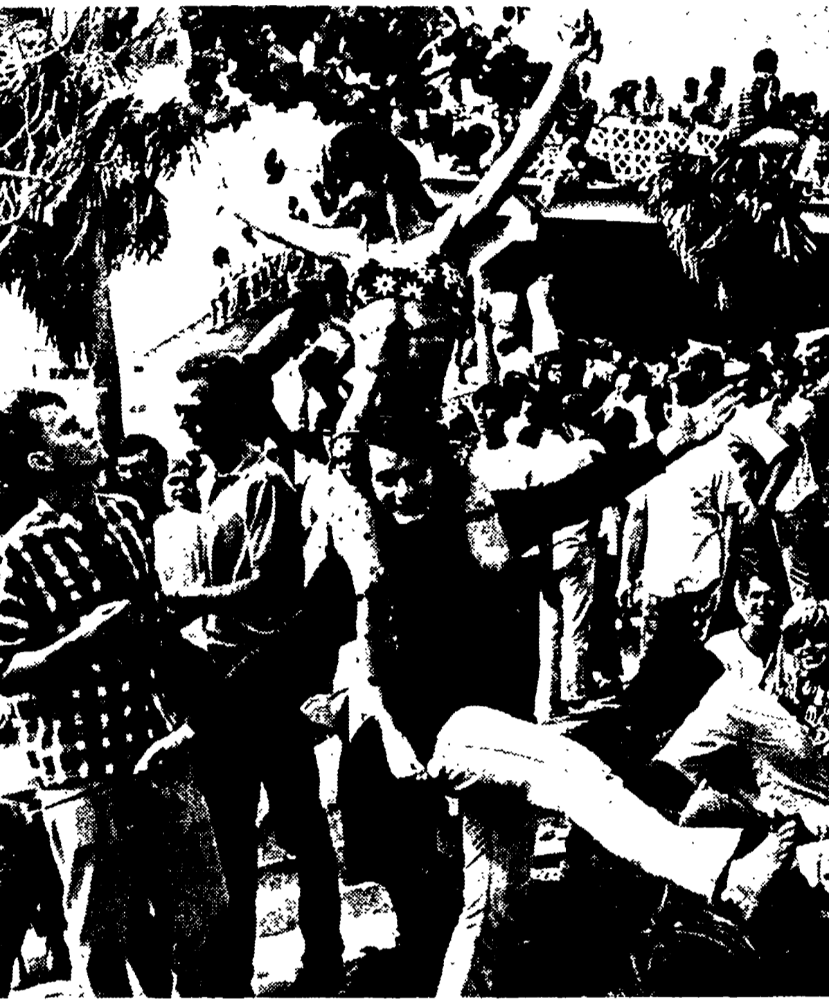
L'ultima protesta americana è quella degli «hippies» soltanto un mezzo per estraniarsi da una società...