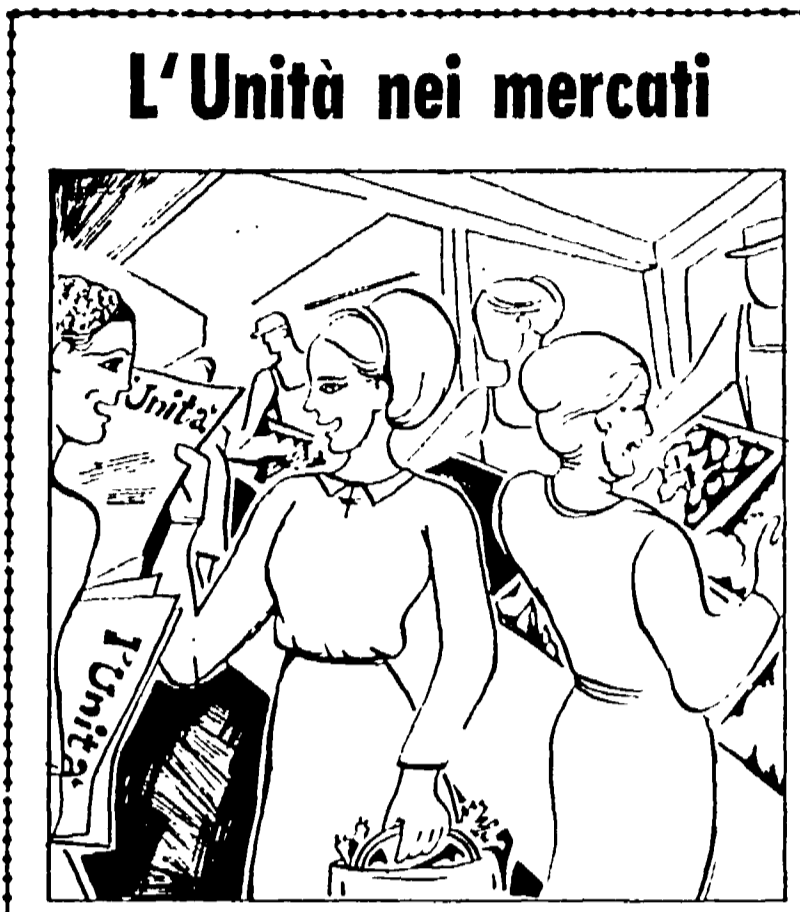
L'Unità nei mercati

In numerosi centri, grandi e piccoli, le « Amiche dell'Unità » e i compagni diffondono già, ogni giovedì, migliaia di copie del nostro giornale che viene portato nelle case, nelle fabbriche, nei mercati.