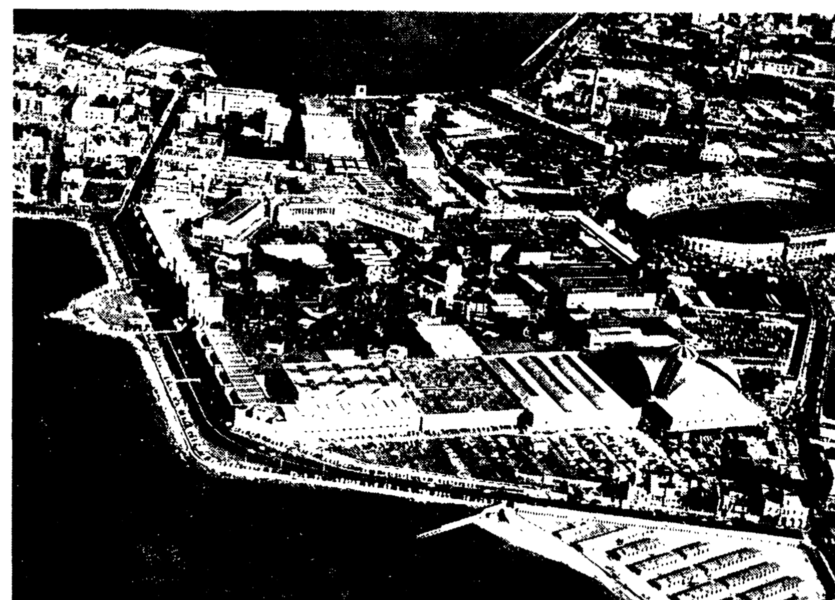
Una veduta aerea della 31.ma edizione della Fiera del Levante inaugurata ieri

Partecipano per la prima volta Svezia e Iran - Un manifesto del PCI denuncia i danni per gli scambi commerciali e i pericoli alla pace causati dalla tensione alimentata dalle potenze imperialistiche nel Mediterraneo