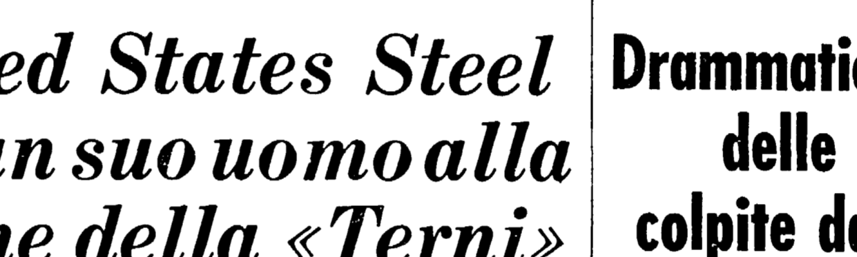
Questo è il grafico della «piramide» che dirige la «Terni»

«Scossa di assessment» ai vertici dell'Acciaieria