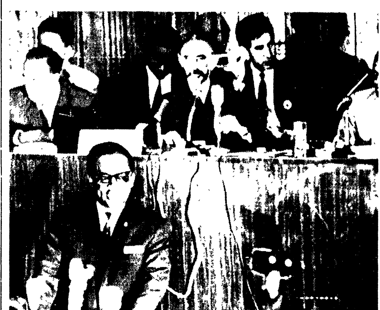
KINSHASA. Sono continui i lavori della quarta sessione della conferenza al vertice dell'organizzazione dell'Unità africana (OUA). A presidente della sessione è stato eletto il generale Mobutu, presidente del Congo-Kinshasa; i presidenti del Ciad, della Zambia, della Liberia, del Ruanda, del Gambia, della Mauritania e del Sudan sono stati invece nominati vicepresidenti. Il premier sovietico Kossighin ha fatto pervenire un messaggio augurale. Nella foto: un momento della riunione di ieri

Fronte unitario contro i colonialisti inglesi