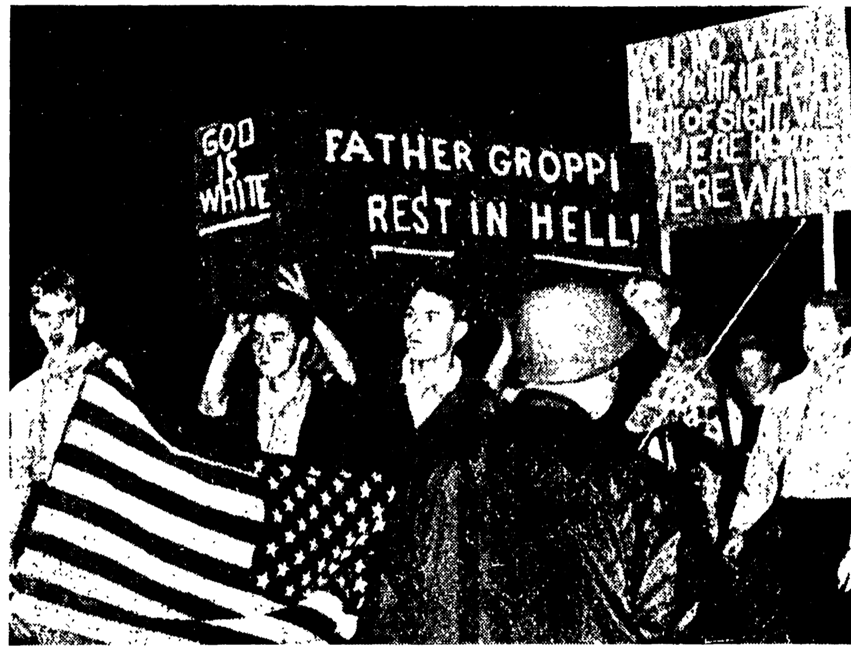
MILWAUKEE — La manifestazione dei razzisti contro padre Groppi. Sulla bara è scritto: «Padre Groppi all'inferno» «Dio è bianco»

Nostro servizio RICHMOND (Virginia), 15.