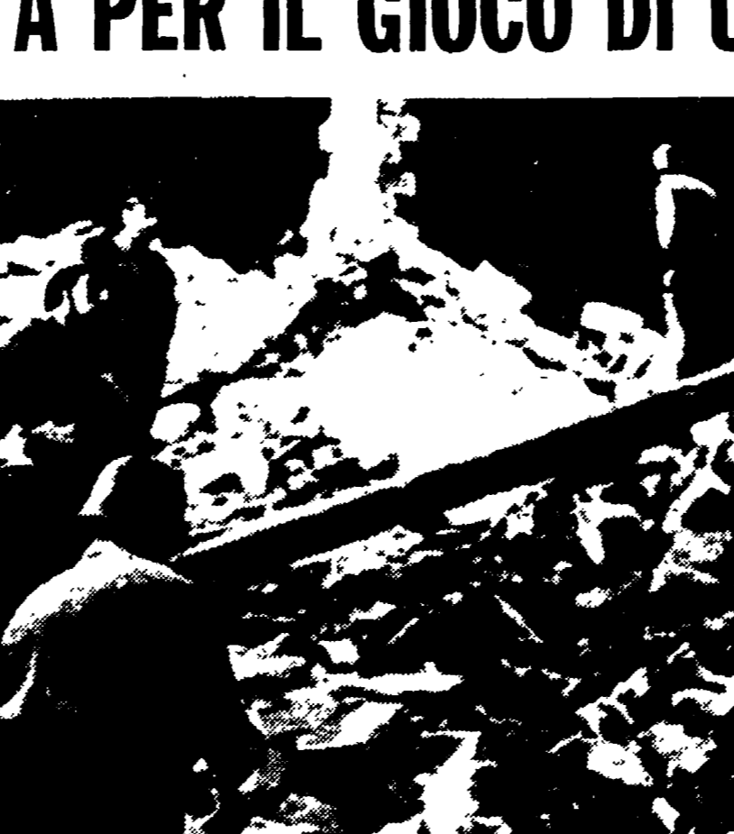
LONDRA, 21. Un tesoro del '700 è stato recuperato, in buona parte, da una squadra di sub, che hanno compiuto l'impresa battendo sul tempo i sommozzatori della marina militare. Le monete d'oro e d'argento che sono state raccolte sul fondo del mare assommano a un valore superiore al miliardo e tre quarti; ma, ha detto il capo della spedizione, si tratta soltanto di una piccola parte del tesoro.