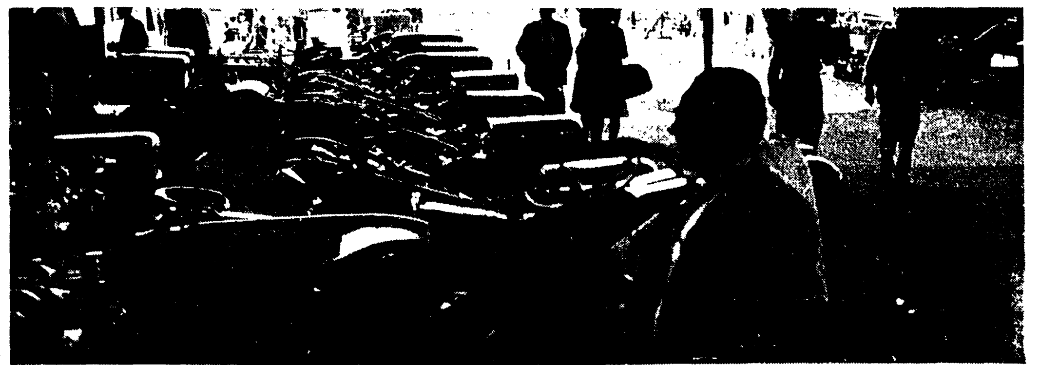
Nelle foto: accanto al titolo, una veduta panoramica dell'area della Fiera. Qui sopra: un particolare degli stands dedicati ai macchinari agricoli