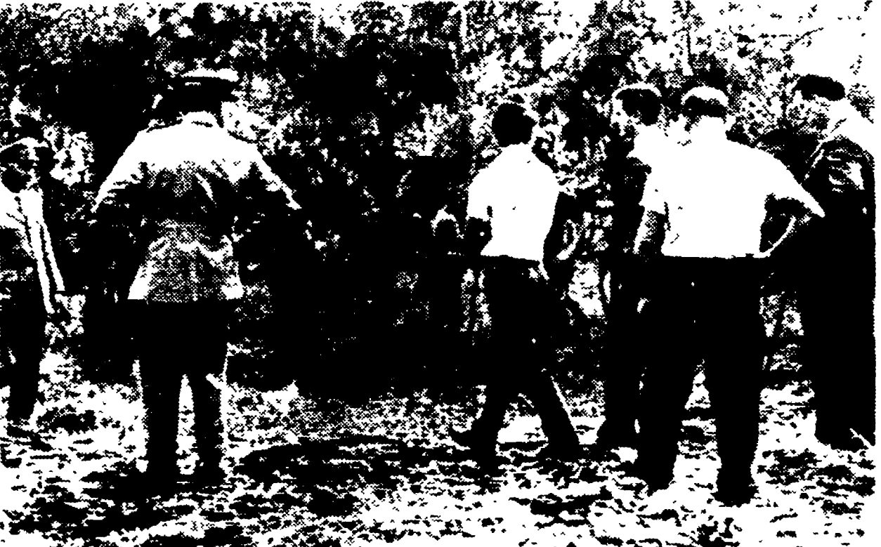
Anche ieri decine di uomini, come si vede nella foto, hanno preso parte a una nuova «superbattuta» che si è conclusa però senza alcun risultato.