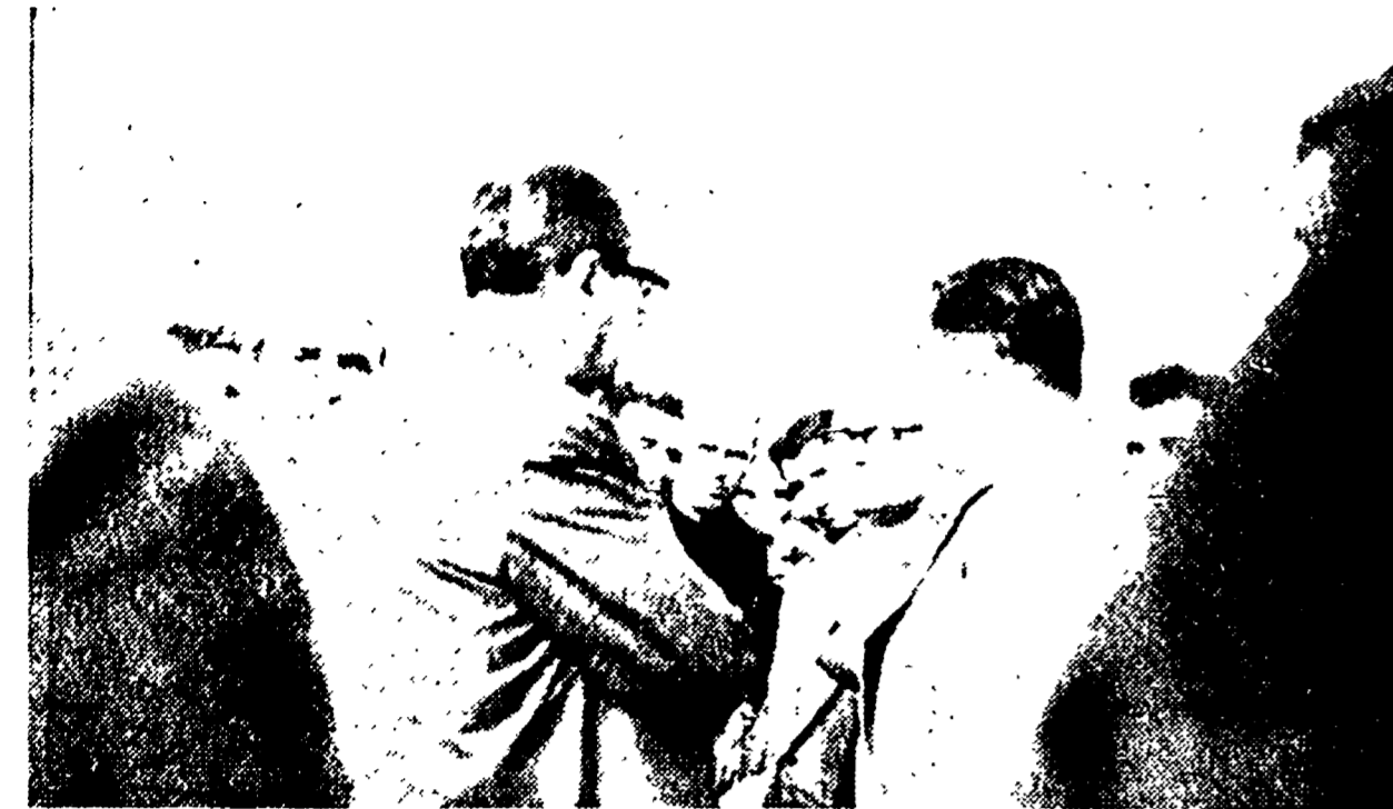
Parlamentari e operai si sono incontrati davanti ai cancelli della Maraldi... (Continued from previous page)

Questa mattina l'assemblea dei lavoratori della Maraldi... (Continued from previous page)