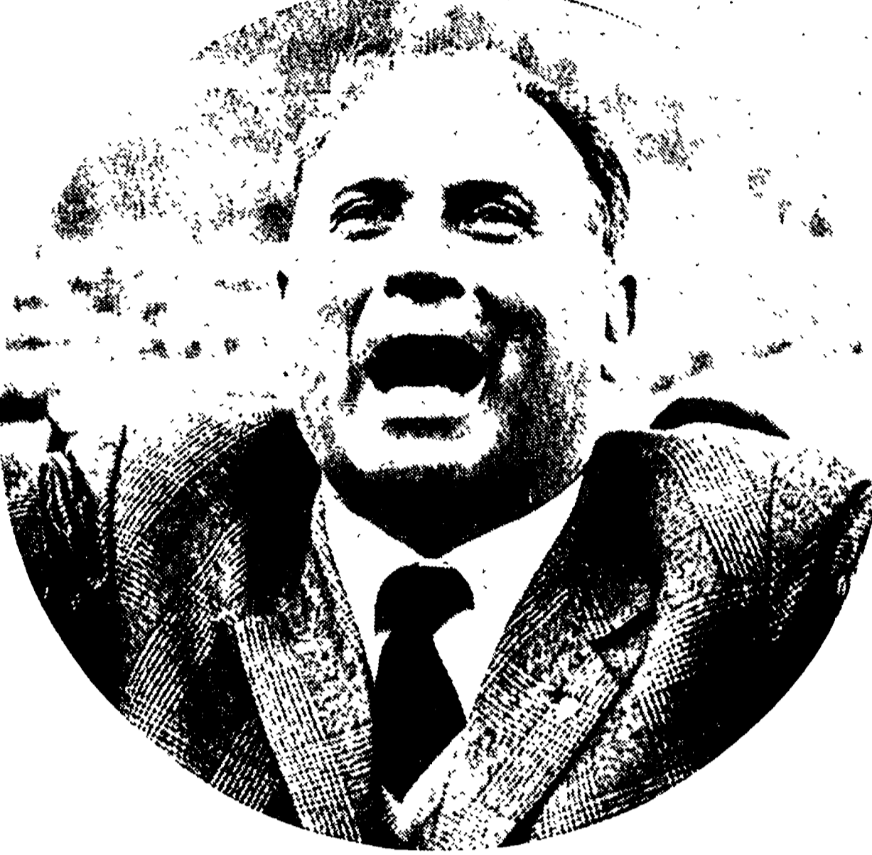
Anche stasera Pugliese e la Roma dovrebbero restare in festa alla classifica: magari potrebbero anche aumentare il vanlaggio

OMNIUM ITALIA-FRANCIA 12-12. VELOCITA': Bissoli (It.) b. Guyot (Fr.) (ultimi 200 metri in 13"2); Anquetil b. Gimondi (13"3). DIECI GIRI CON TRAGUARDO OGNI DUE GIRI: Bissoli b. Guyot 8 punti a 7; Anquetil b. Gimondi 8 punti a 7.