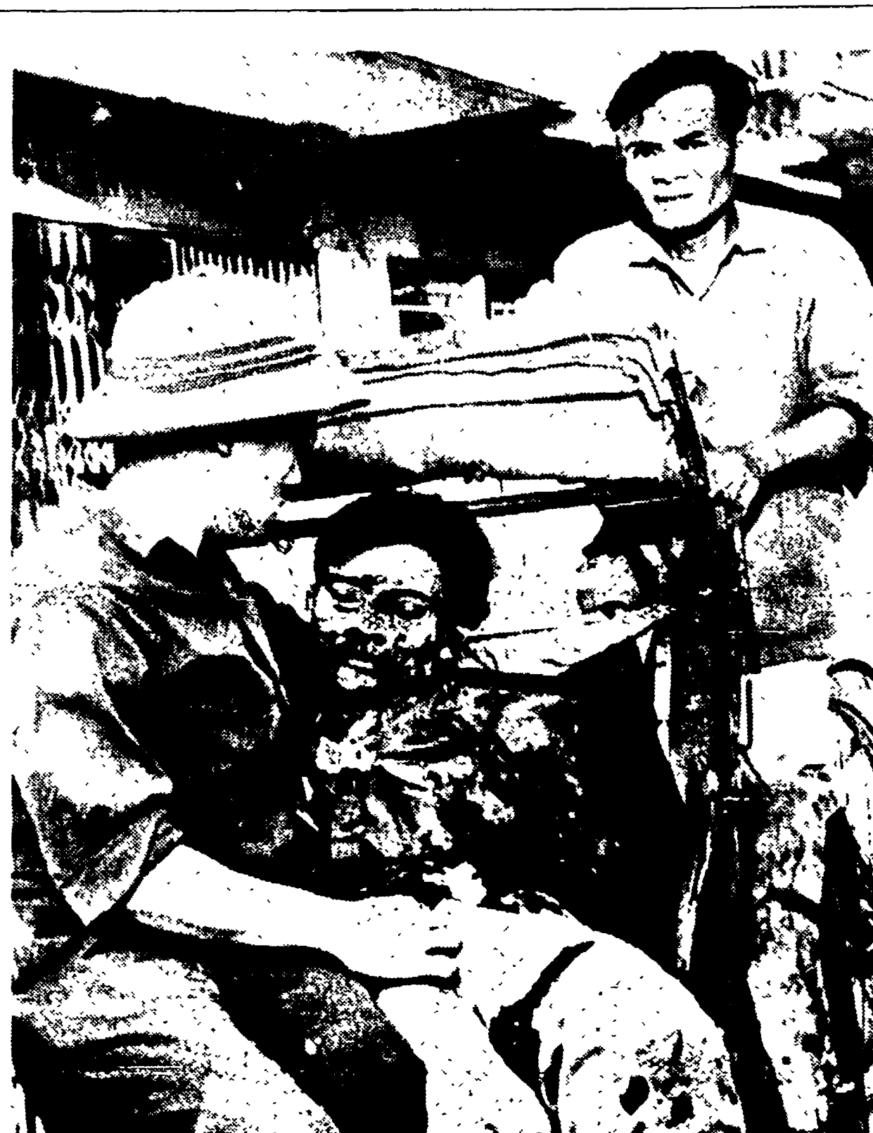
Da alcuni giorni, con bugiarda protesta, i giornali borghesi stanno « montando » la notizia di un presunto « massacro » di civili sud-vietnamiti da parte delle forze F.V.L.; « massacro » doppiamente rumorosamente annunciato dai comunisti USA e collaborazionisti di Saigon (300 uccisi), poi smentito (un civile morto per sventura durante un combattimento), poi « reinventato » in due riprese, fra l'altro ieri (121 morti) e ieri (144). Si tratta, che si rispecchia in tante notizie e immagini, fra cui quella che oggi pubblichiamo: un giovane abitante di Hanoi, gravemente ferito durante un bombardamento americano con « bombe a biglie » e missili ariete nel quartiere residenziale di Hoan Kiem (Hanoi), soccorso da un soldato e trasportato in ospedale a bordo di un triciclo-tassì. Nel bombardamento, molti abitanti di Hanoi sono rimasti uccisi.