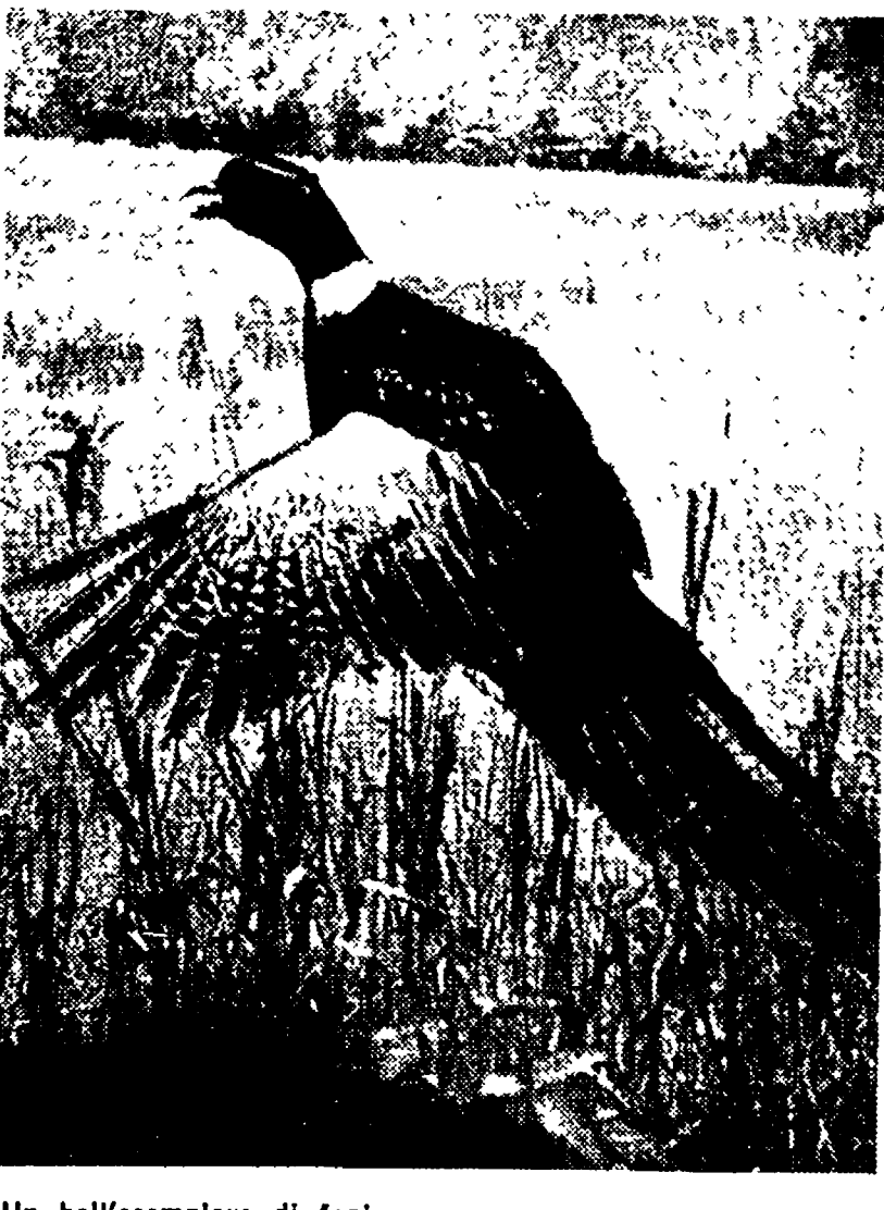
Un bell'esemplare di fagiano.