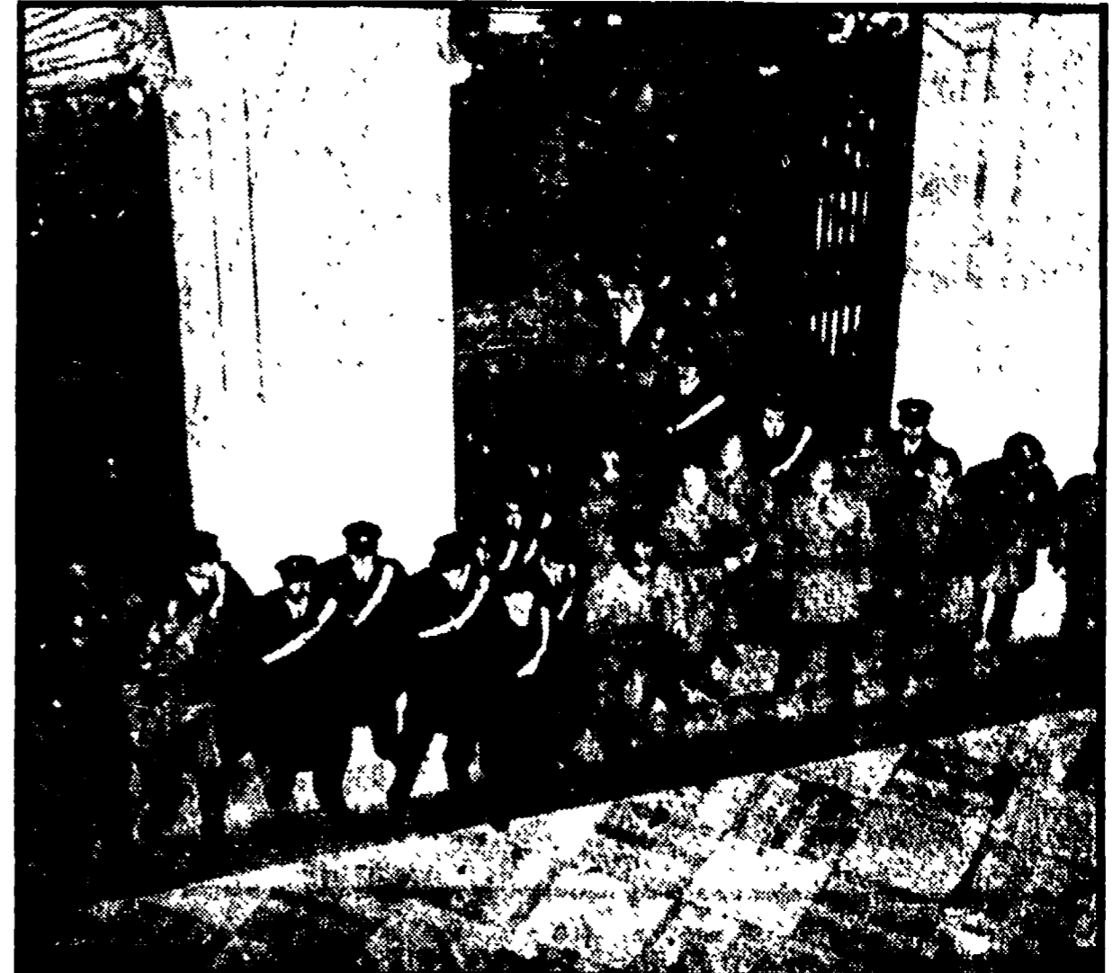
IAPOLI — Carabinieri e polizia, manganello alla mano, all'interno dell'Università. (Telefoto)