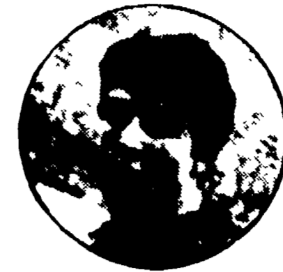
BRUGNERA si è detto sicuro di disputare una bella partita e di dare un valido contributo alla vittoria della sua squadra.