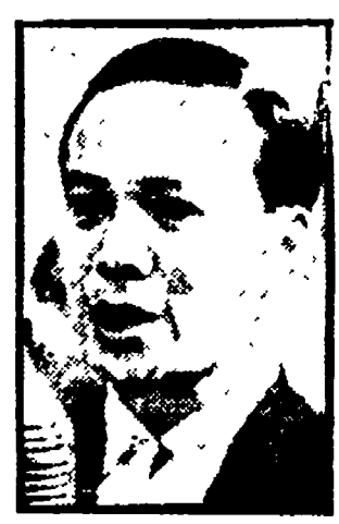
NGUYEN VAN THIEU La «scalata» o la fine

Quanto all'azione dei paesi socialisti, il documento indica, in sintesi, le seguenti linee: