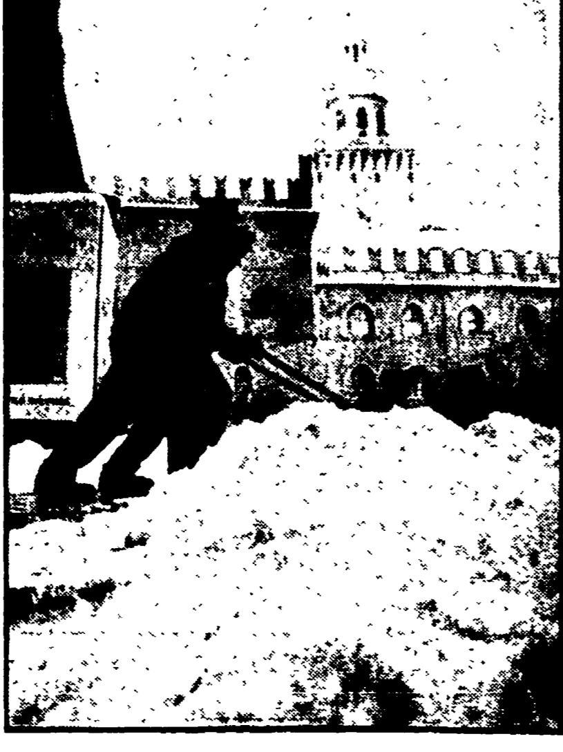
Prosegue il freddo e il maltempo in tutta Italia. La situazione è in lenta evoluzione e non si prevede un miglioramento ancora per qualche giorno...

Ieri il gelo ha provocato un'altra vittima