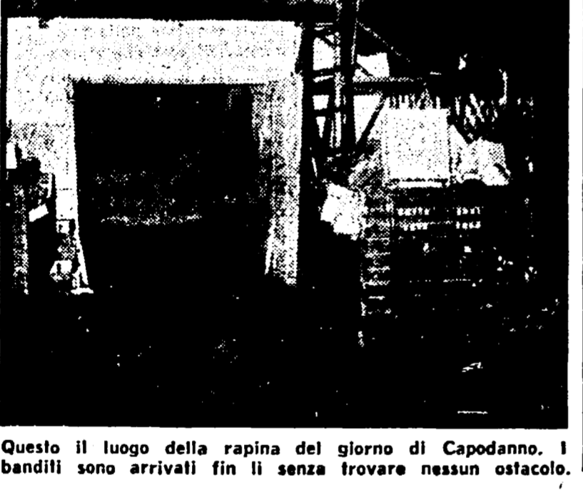
Questo il luogo della rapina del giorno di Capodanno. I banditi sono arrivati fin lì senza trovare nessun ostacolo.