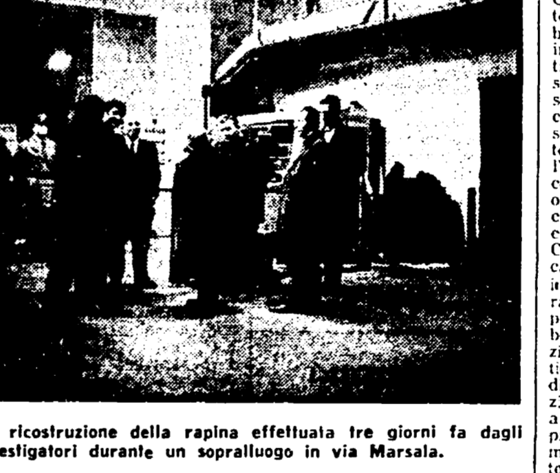
La ricostruzione della rapina effettuata tre giorni fa dagli investigatori durante un sopralluogo in via Marsala.