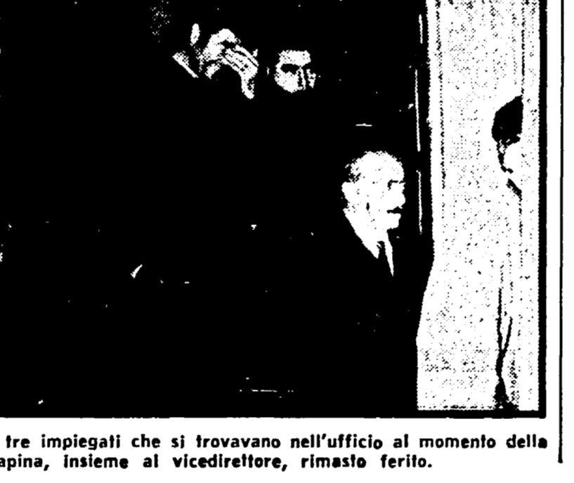
I tre impiegati che si trovavano nell'ufficio al momento della rapina, insieme al vicedirettore, rimasto ferito.