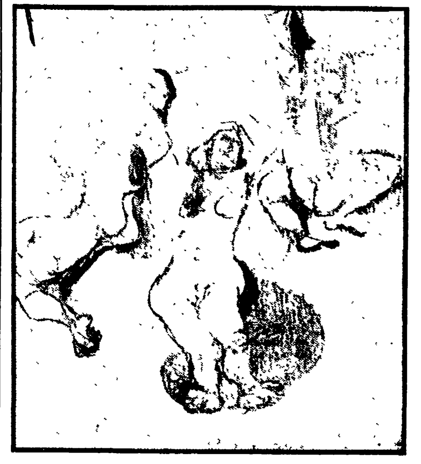
Fausto Pirandello: «Bagnanti al sole», 1953

C'è un godimento raro, tutto speciale, e dei sensi e dei pensieri, a guardare la fitta serie di bastoni che Fausto Pirandello espone alla galleria «Il Gabbiano»... Vincitori e vinti di Remo Brindisi