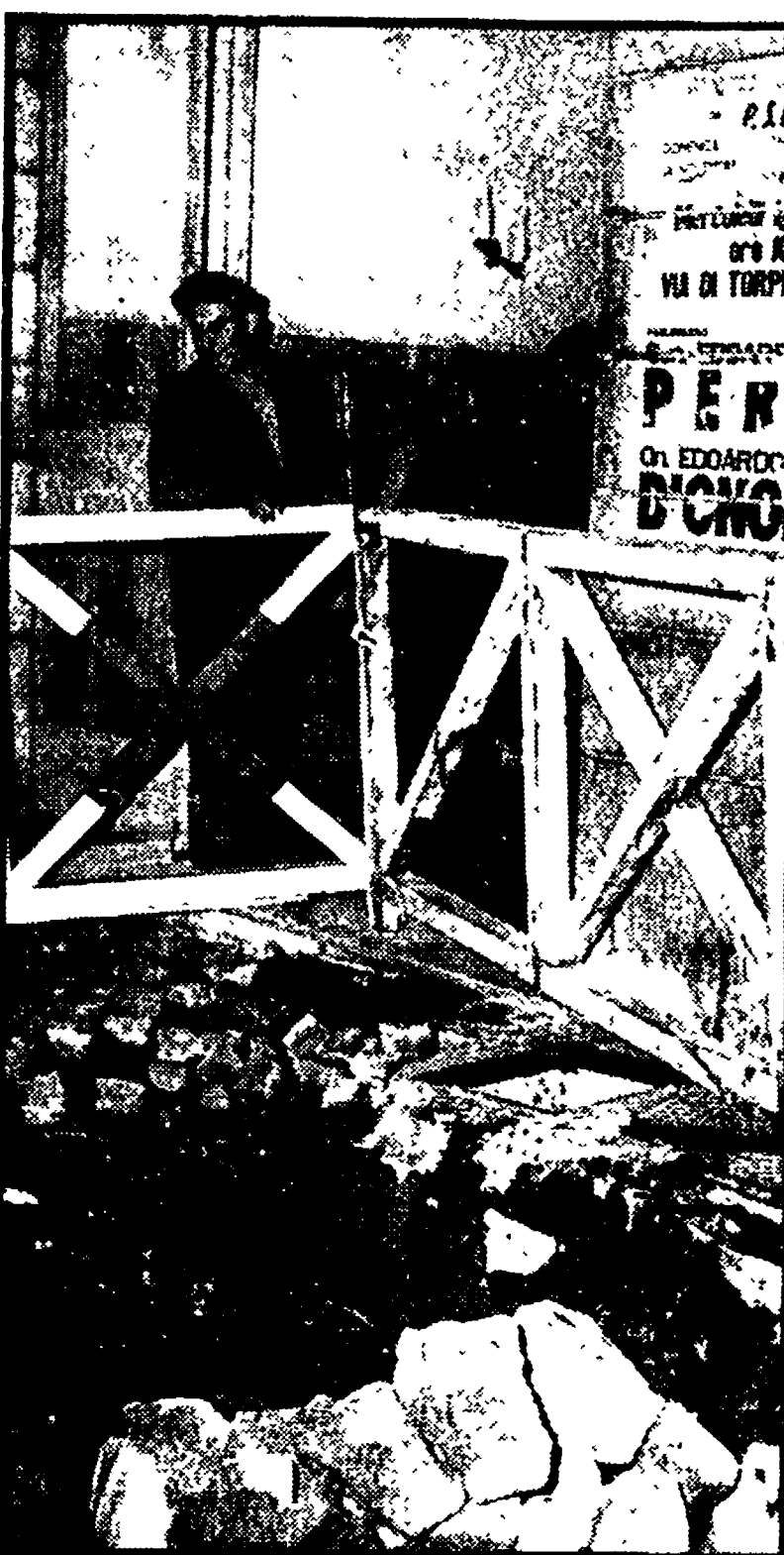
Voragine in via Casilina. Per la rottura di un tubo dell'acqua, una grossa buca si è spalancata ieri pomeriggio davanti ai numeri 361 e 363 della strada. Un bimbo di 6 anni che stava passando in quel momento è anche caduto nella voragine, fortunatamente senza restare ferito.

Hanno rubato solo 21.900 lire e qualche cambiale