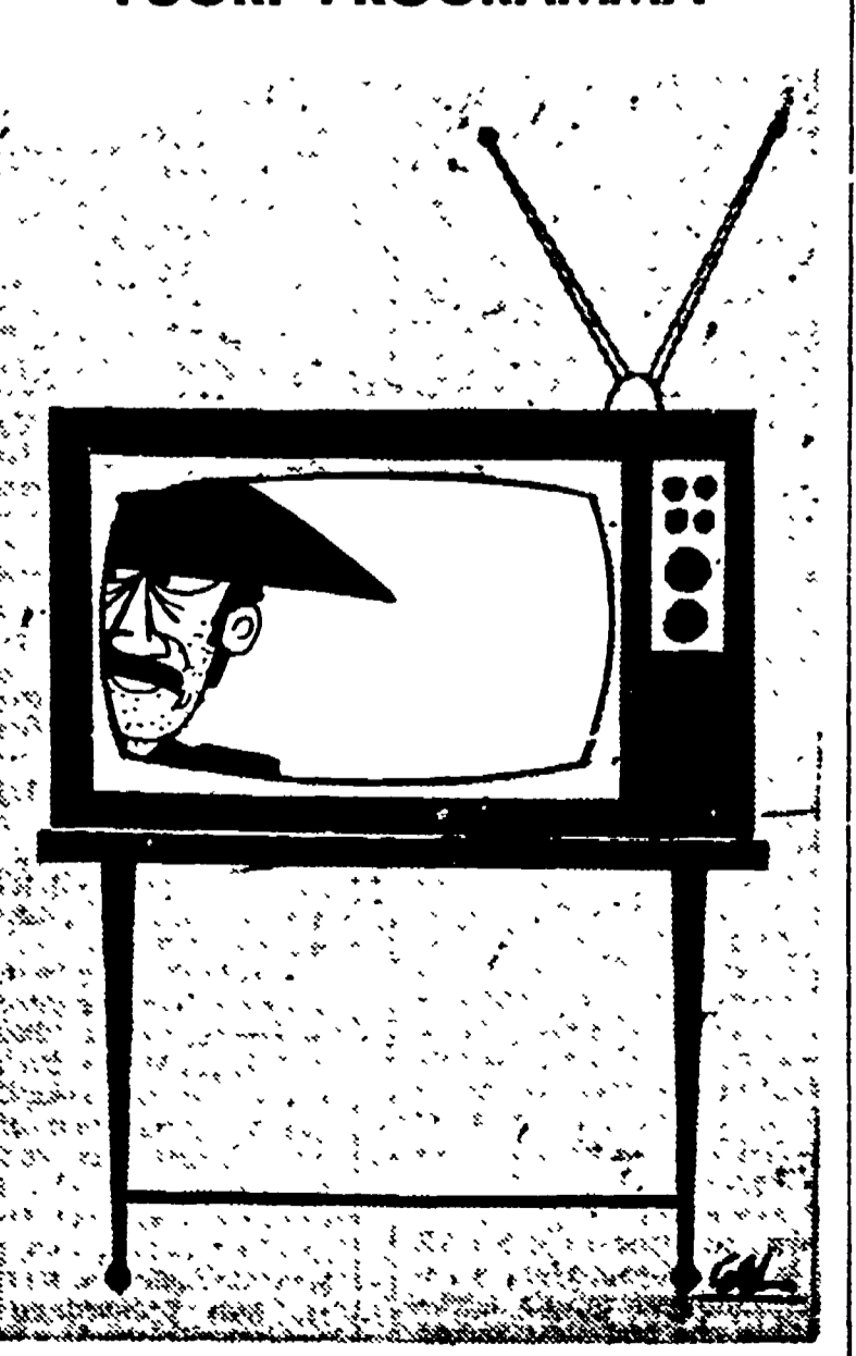
Piccolo SIFAR alla RAI-TV

La sospensione posta al bilancio dell'INPS, giustificata dalla trattativa aperta sull'intera materia, è stata dal governo arbitrariamente estesa al Parlamento e alle organizzazioni dei lavoratori autonomi.