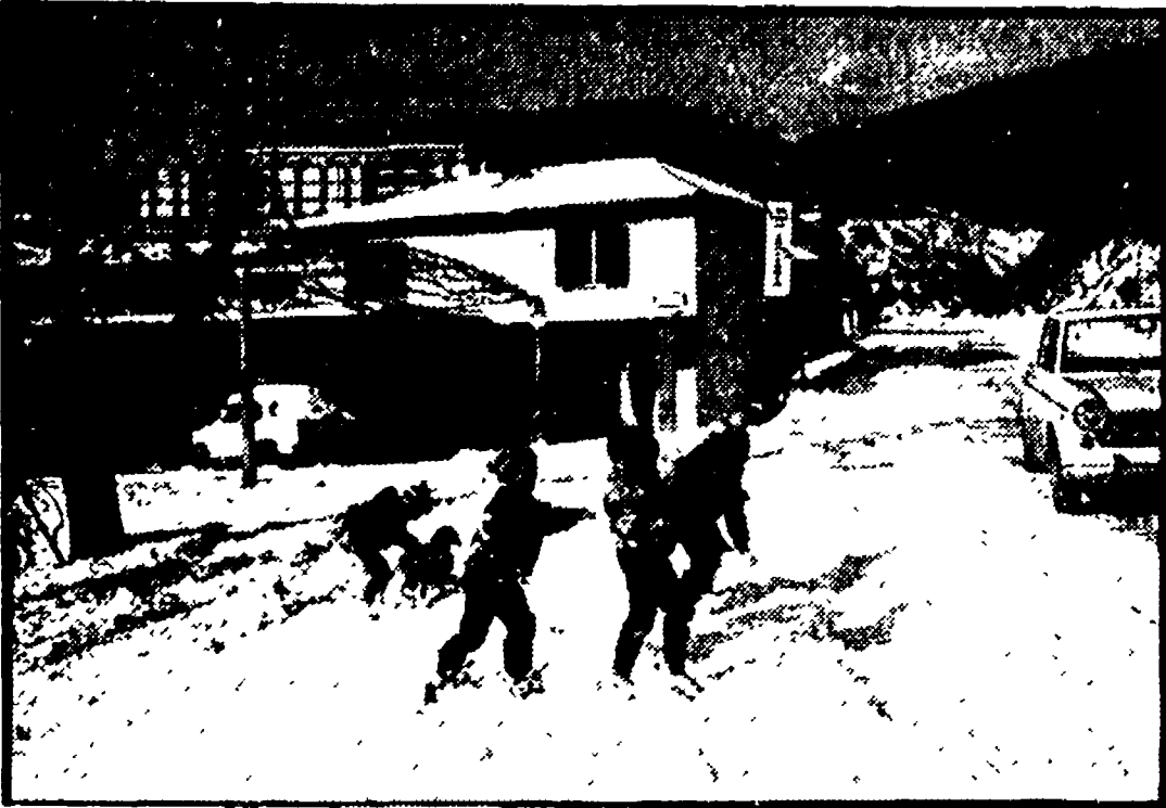
Freddo cane anche ieri a Roma e nei Castelli. Il termometro, ancora ieri mattina alle 8, segnava i quattro gradi sotto zero: l'acqua delle fontane è gelata, sulle strade si sono formati spessi e pericolosi lastroni di ghiaccio. Nei Castelli, poi, la neve non accenna a sciogliersi. Le previsioni non sono allegre: il grande freddo continuerà. Nelle foto (da sinistra): un'immagine della campagna laziale; la fontana di piazza Barberini a Roma e il centro di Torino sotto la neve.

La linea Pescara-Roma bloccata dal deragliamento di un treno merci - Ghiacciato il Trasimeno, un manto bianco di tre metri sull'Alto Sangro - Il prefetto di Campobasso smarrito nella tempesta - Difficoltà sulle strade di tutto il centro della penisola - 30 sottozero in provincia di Sondrio