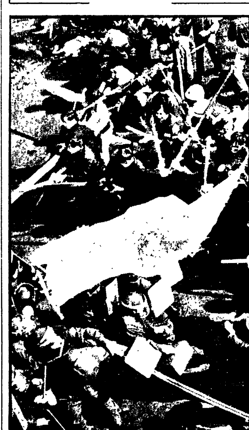
TOKIO - Violenti scontri si sono verificati oggi a Tokio fra la polizia e duecento studenti dell'organizzazione di sinistra « Sanpa Rengo », che si preparavano a partire in treno per il porto di Sasebo, allo scopo di partecipare alle manifestazioni contro l'arrivo, giovedì, della portaerei atomica USA « Enterprise », che partecipa attivamente con la VII flotta all'aggressione contro il Vietnam. 131 studenti sono stati arrestati. La « Sanpa Rengo » sta tentando di far affluire a Sasebo duemila giovani, mentre i partiti comunista e socialista organizzano un comizio a cui dovrebbero partecipare circa 60 mila persone.

BONN, 14. Il « fuhrer » dei neonazisti tedeschi, Adolf von Thadden, ha dichiarato a Monaco nel corso di una conferenza stampa che la posizione assunta dal governo di Bonn in merito alla nota del governo sovietico sul risorgere del nazismo nella RFT corrisponde sino in fondo alle concezioni del partito nazional-democratico (NDP), che è appunto il partito dei neonazisti.