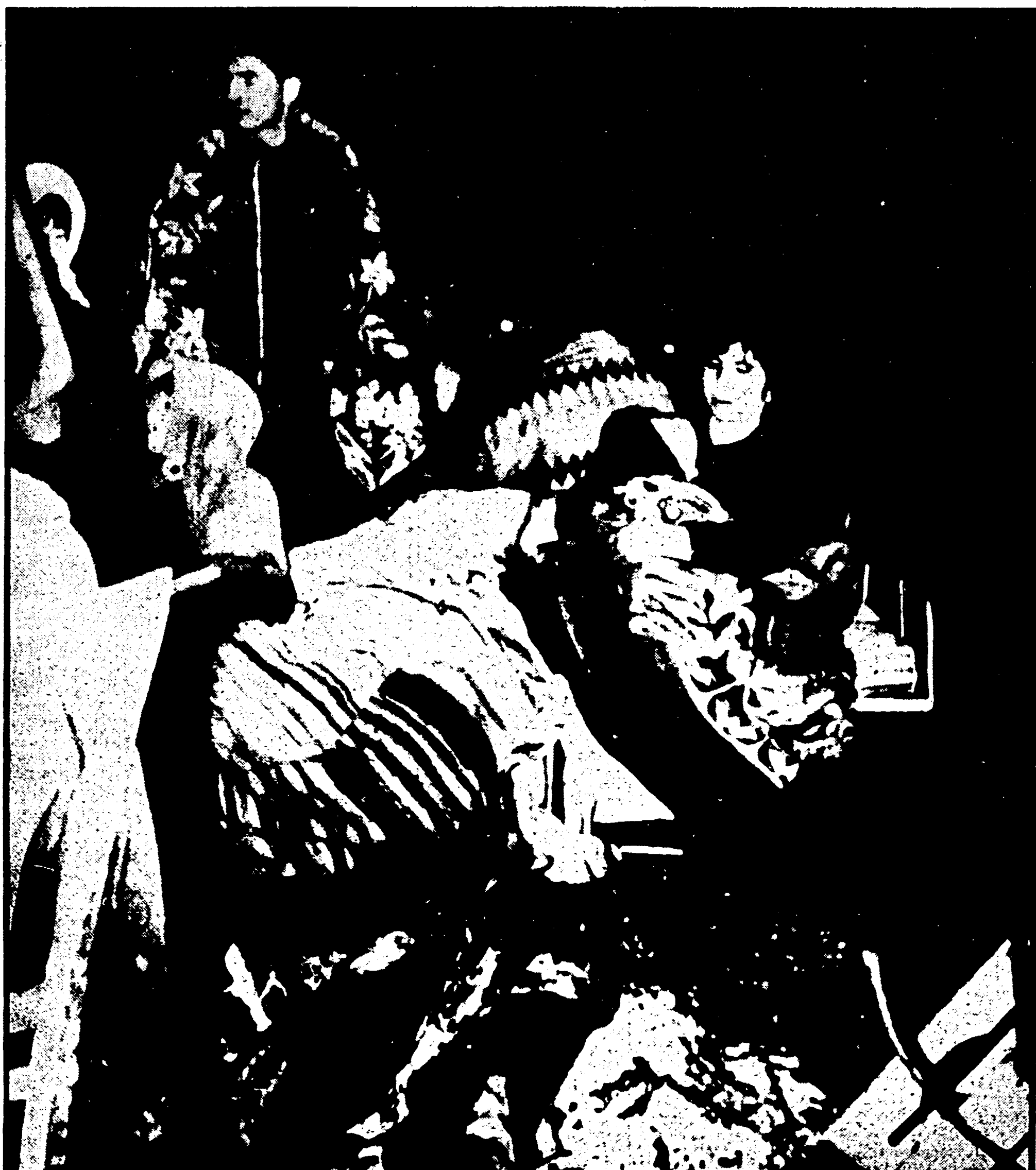
Senza casa, senza cibo, senza medicinali, i superstiti giacciono all'aperto, nel gelo sferzante. I volti degli adulti impietriti dalla angoscia, i bimbi infagottati nelle poche coperte strappate dalle macerie. E' una immagine sconvolgente colta a Gibellina, uguale a tante altre dei paesi dove il terremoto ha distrutto tutto

Con un ponte aereo di elicotteri. Cesare De Simone (Segue a pagina 3)