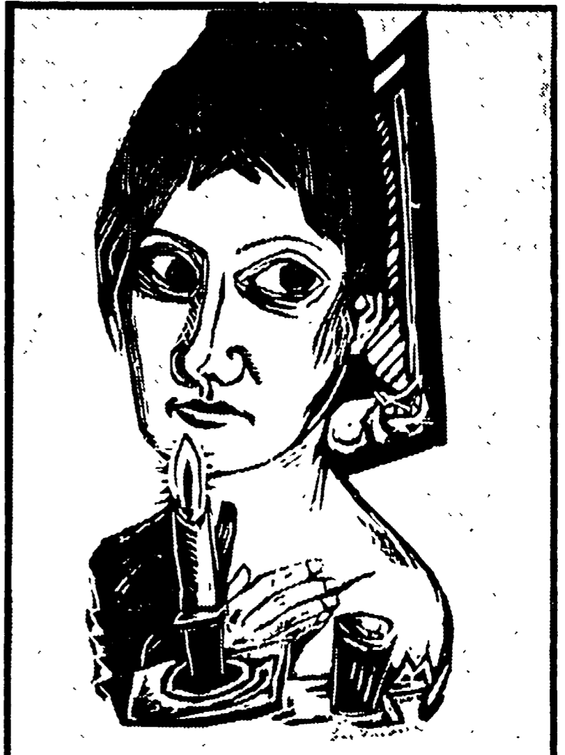
Max Beckmann: «Donna con candela» - 1920