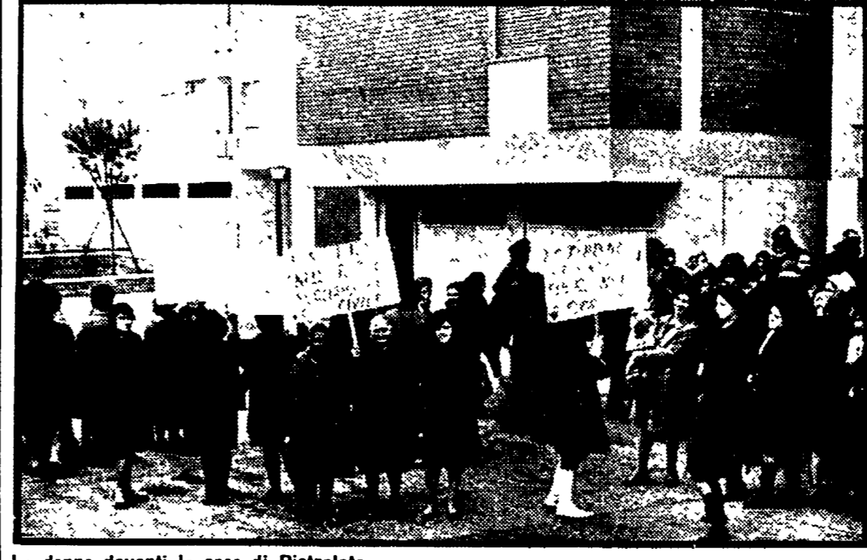
Le donne davanti le case di Pietralata