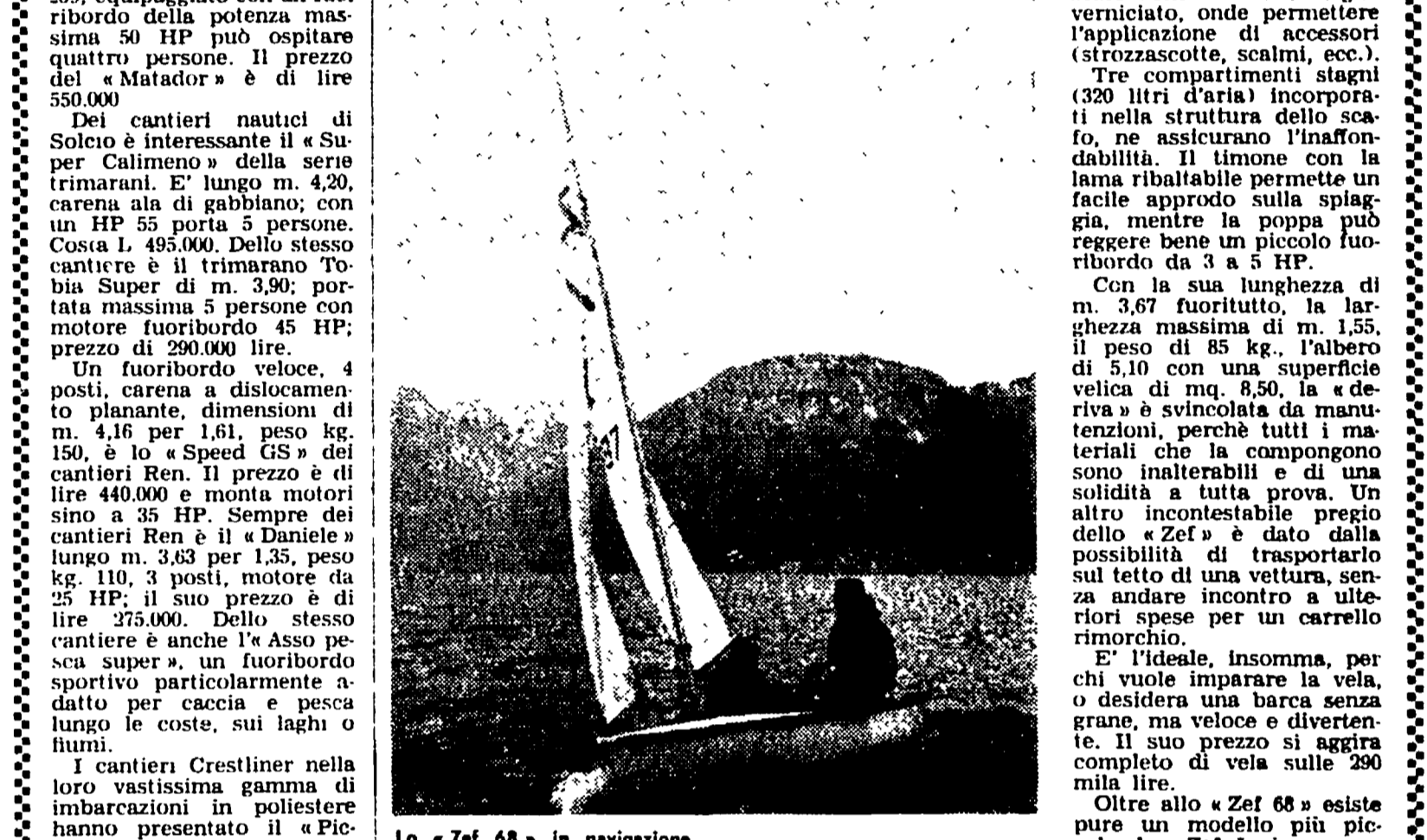
Lo «Zef 68» in navigazione.

Soltanto unità costruite in soli tre anni: lo «Zef» è diventato così la «deriva» più diffusa al mondo. Creata dalla grande industria francese de «La Prairie» è facile da condurre, divertente e persino acrobatico con un buon timoniere.