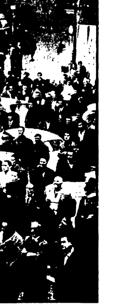
Un aspetto della manifestazione: piazza Navona è invasa dalle carrozzine e dalle lavoratrici

no esistente, e delle amare delusioni, quando era il momento della risposta: «non ci sono posti...». Per questo, per salvare il diritto al lavoro, sono venute a Roma da tutt'Italia, hanno portato nelle strade della capitale, la loro protesta, la loro decisa volontà di lotta.