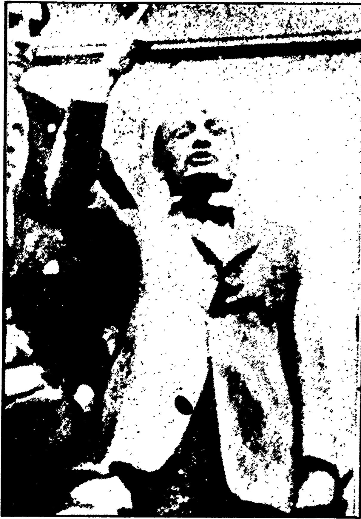
Mussolini, in una delle sue tipiche e demagogiche «pose» durante un comizio nel 1919

Il legame politico e finanziario di Mussolini e dei nazionalisti con gli industriali - Un fronte di classe aggressivo e omogeneo - La questione dell'interventismo democratico