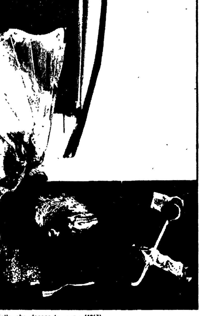
Dal colle di Redipuglia: farfalla che depone le uova (1967)