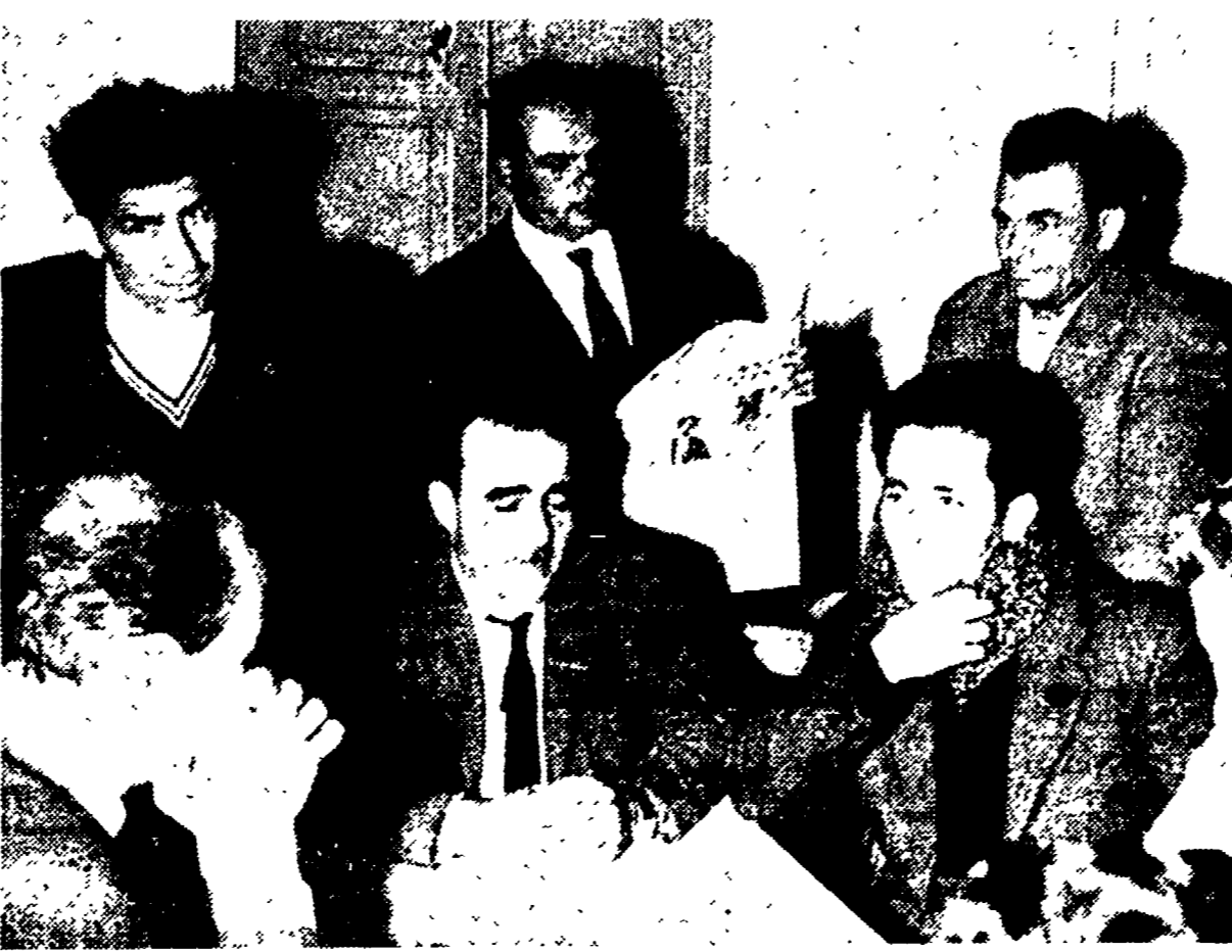
Emigranti sardi in una sezione comunista di Torino