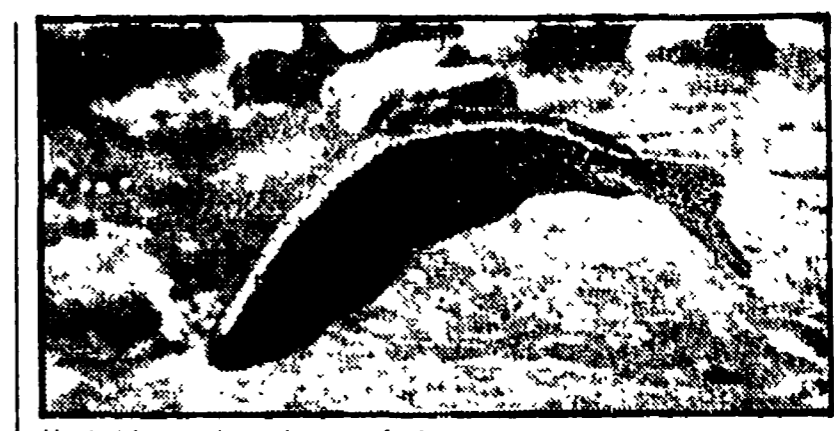
Un bell'esemplare di trota fario

Intorno alla trota è fiorita tutta una letteratura che va dalle rievocazioni alle guide più o meno scritte. Il secondo tempo, dopo il successo del salmone, il fario o trota comune, la marmorata che si trova nella Italia settentrionale, la macropesca che in prevalenza si trova in fiumi dell'Abruzzo (specialmente nel Sangro), la lacustrina e l'iridica.