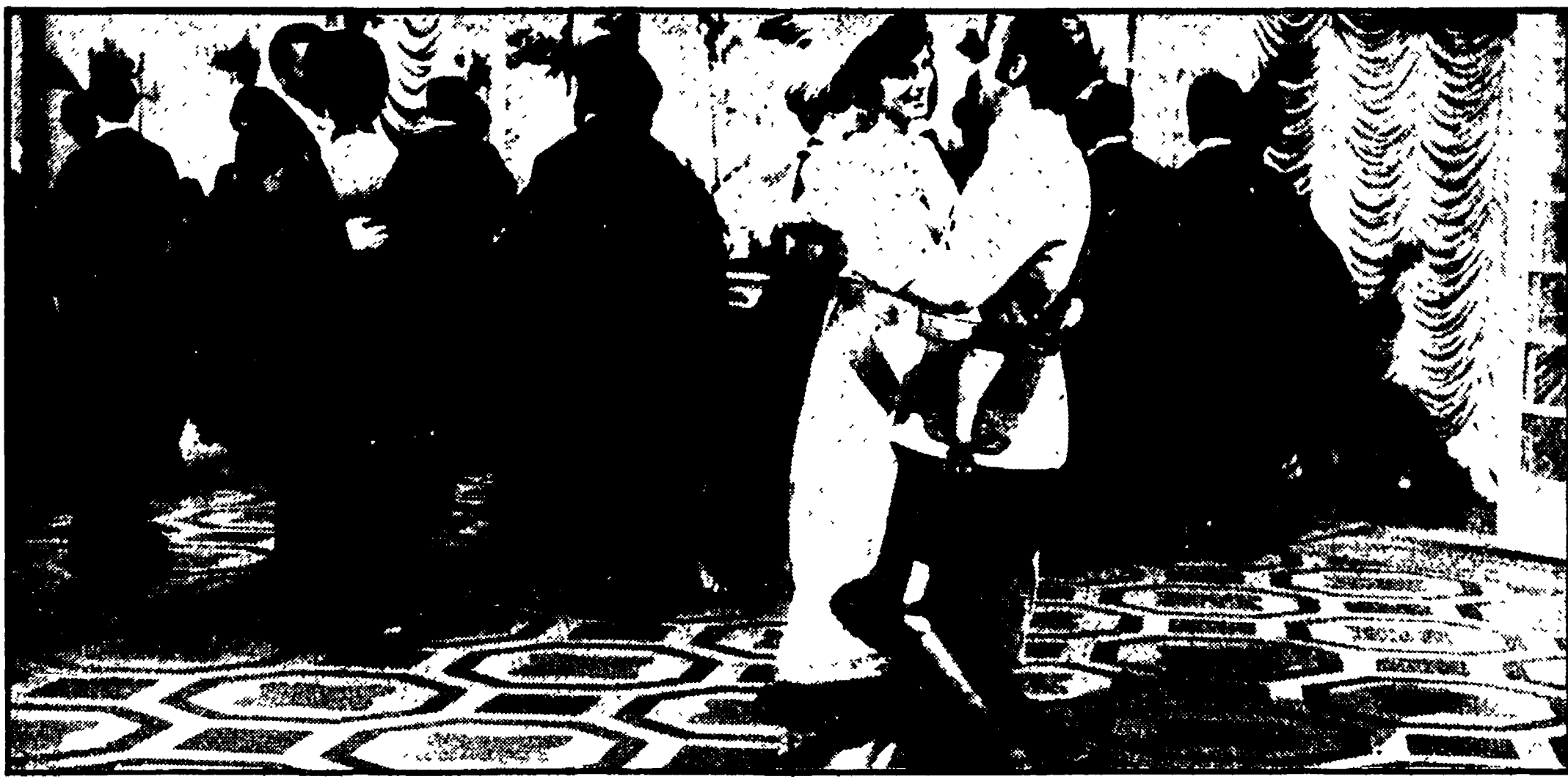
Catherine Spaak e Johnny Dorelli, interpreti della «Vedova allegra»