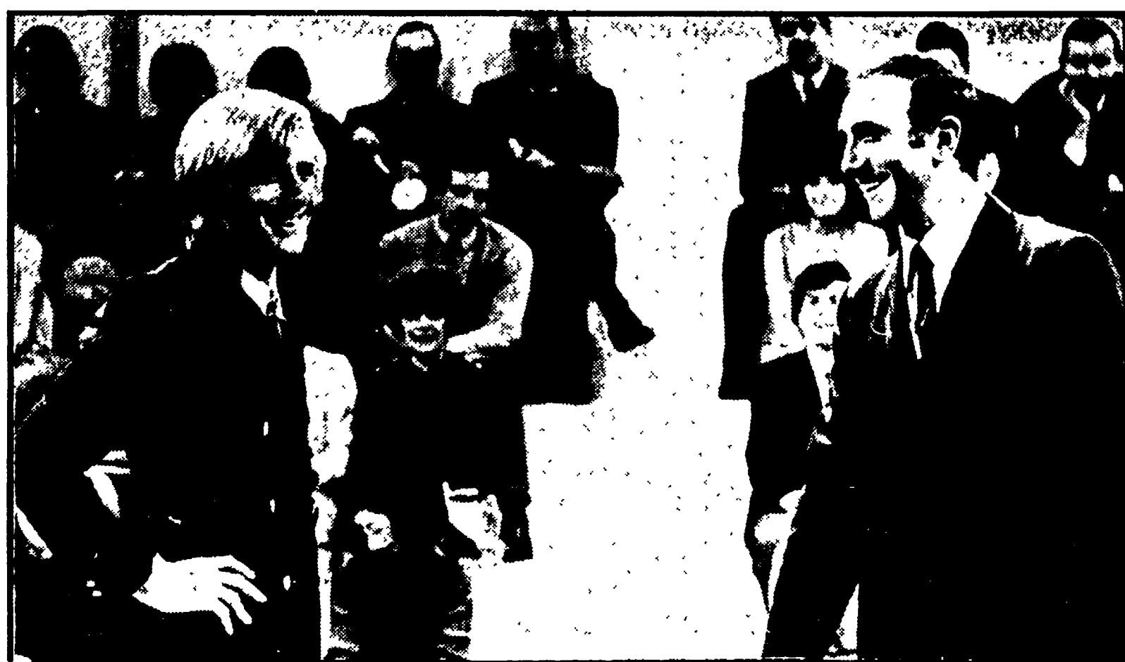
Pippo Baudo e Nino Ferrer in «Settevoci»