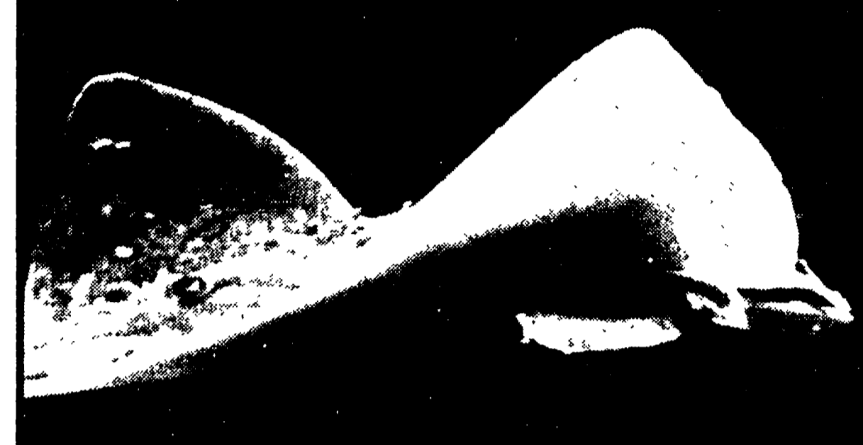
Una razza mentre nuota: non sembra davvero un aquilone? Nei vari dialetti esso è più comunemente nota come: arzilla, baracola, raschia, pigara, rasa, picchira