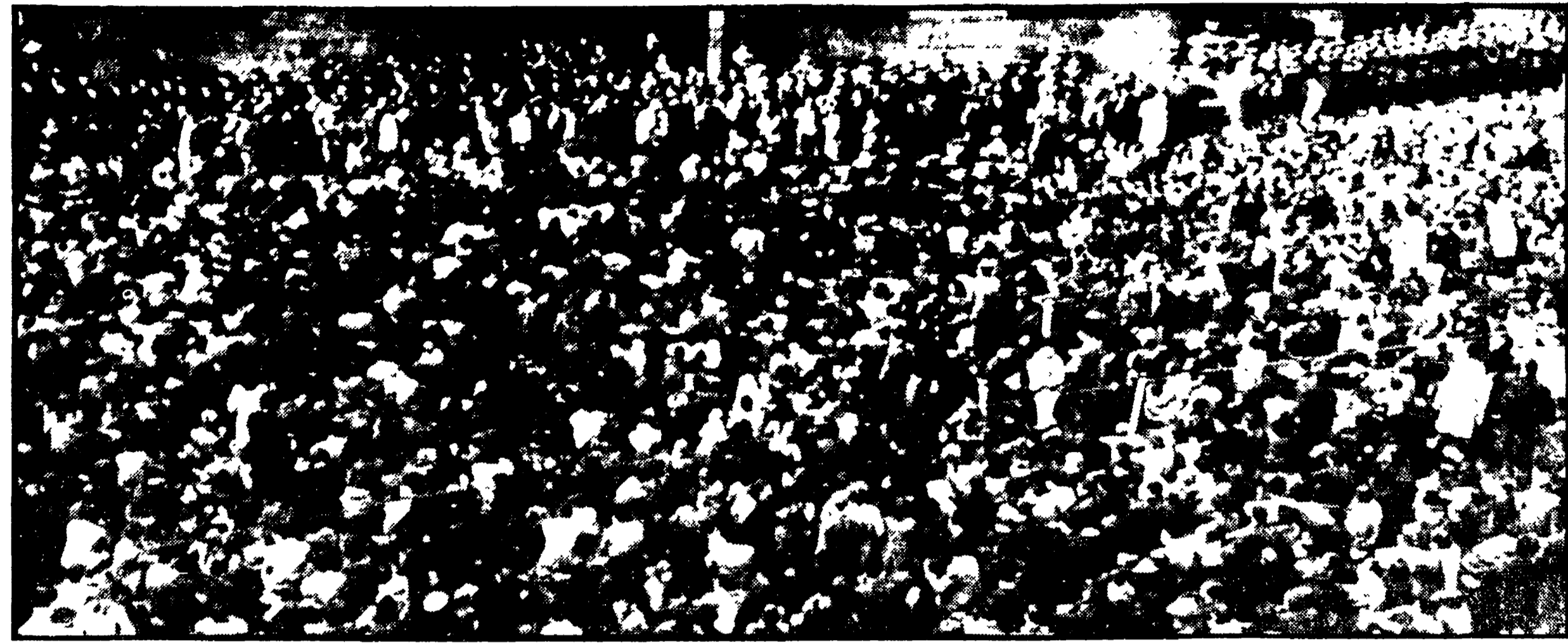
MILANO - Studenti medi e universitari manifestano dinanzi la sede del Provveditorato

La madre lo aveva visto poco prima dalla finestra - Caccia febbrile di Scotland Yard all'assassino - Forse un maniaco