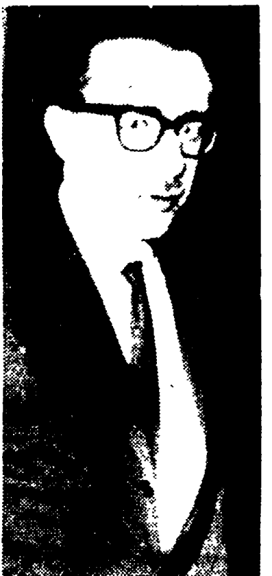
Il ministro Pieraccini.