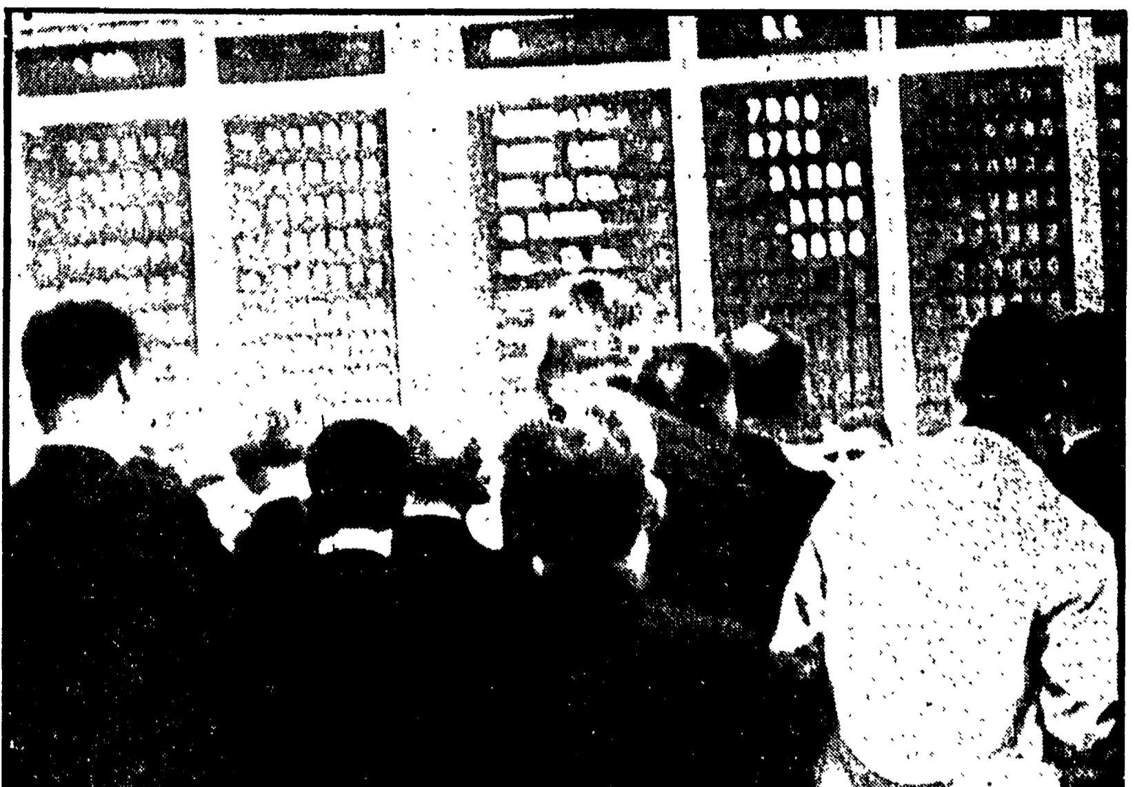
PARIGI - Una folla di operatori e agenti di cambio osserva il tabellone con le quotazioni dell'oro nella prima giornata di mercato libero