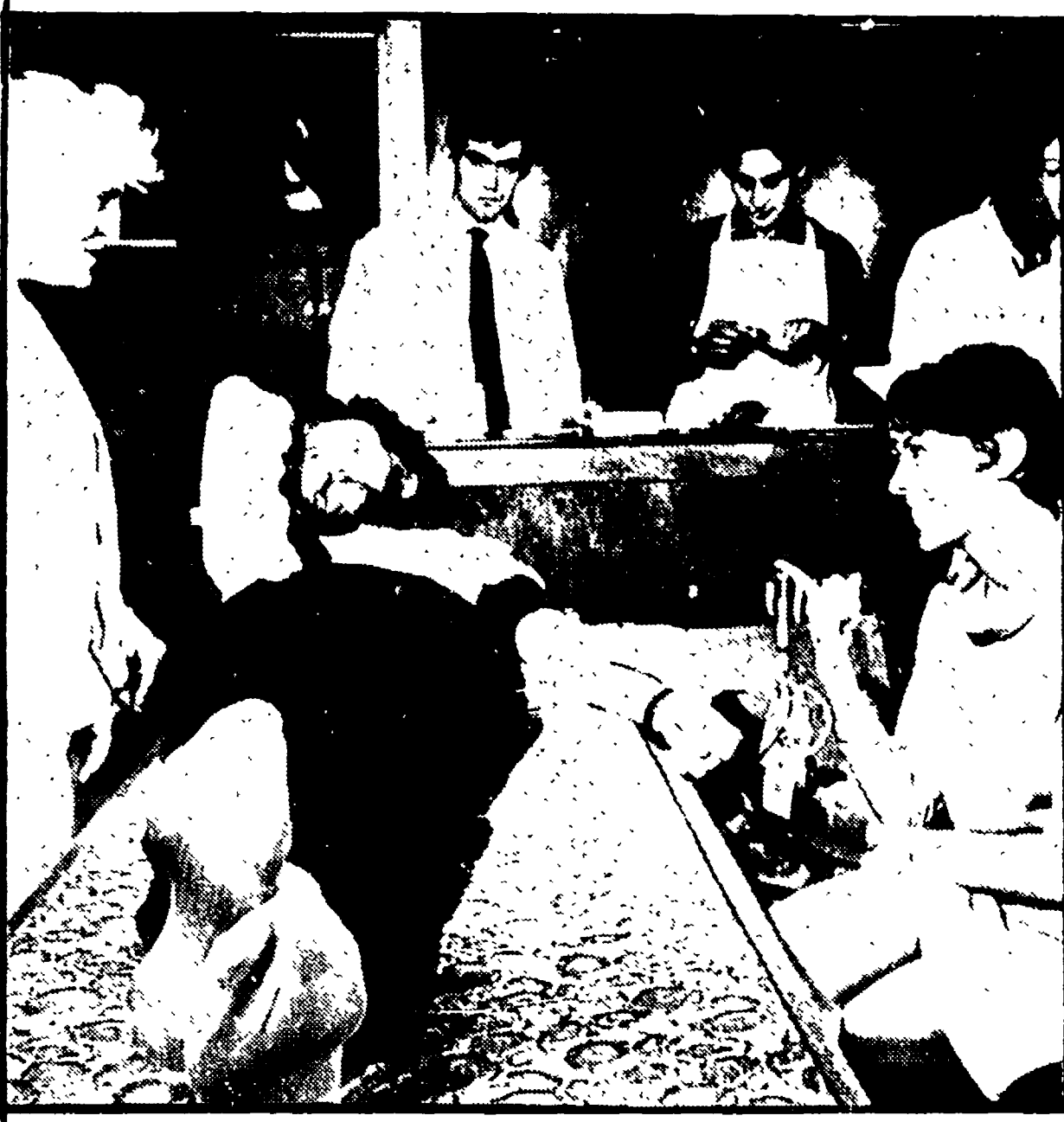
DONA IL SANGUE PER I VIETNAMITI Peak nel Derbyshire, dona il sangue per la campagna promossa dal Comitato per gli aiuti medici al Vietnam. La foto è stata ripresa nel palazzo della Scuola di Economia di Londra.

SALISBURY, 19. In preda al panico il governo razzista di Salisbury ha sostenuto oggi la sua aviazione contro i patrioti africani che da ieri impegnano le truppe rhodesiane in aspri combattimenti.