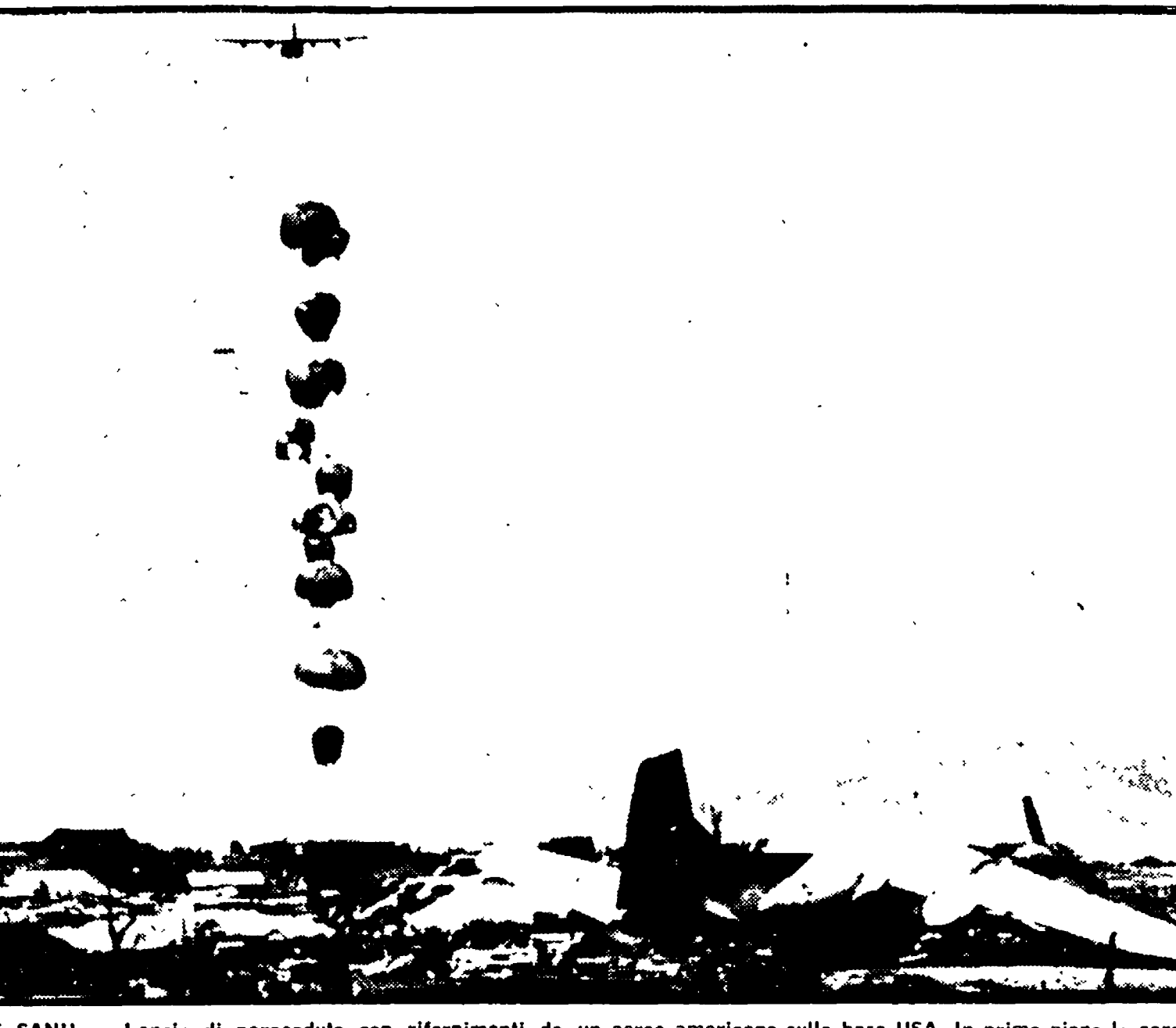
KHE SANH - Lancio di paracadute con rifornimenti da un aereo americano sulla base USA. In primo piano la carcassa di un velivolo da trasporto colpito a terra dall'artiglieria parigiana.

Si torna a parlare con insistenza di una possibile mediazione svizzera per risolvere la guerra nel Vietnam - Una intervista del diplomatico vietnamita ad un inviato di «Paese Sera»