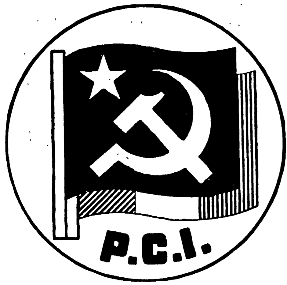
COSI' PER LA CAMERA