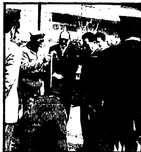
I periti balistici eseguono le misurazioni dal punto dove, presumibilmente, è stata esplosa la revolvera