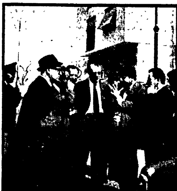
Gli inquirenti, dopo il sopralluogo e la ricostruzione, esaminano i nuovi elementi emersi

I periti balistici smentiscono il racconto del vigile notturno