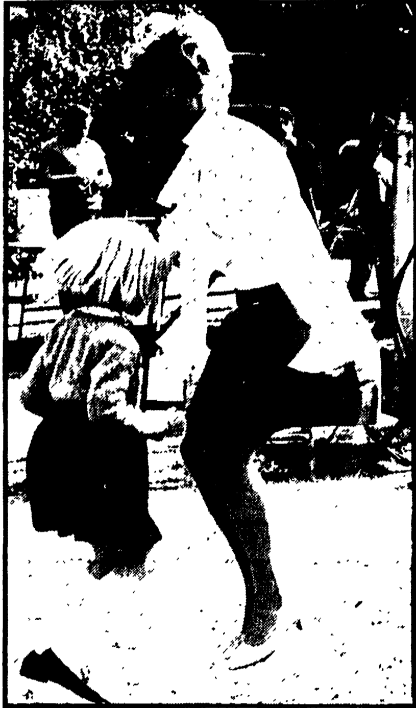
Bibi Andersson si esibisce in un duetto di salto alla corda con una giovanissima partner: la foto è stata scattata durante una pausa della lavorazione del film «Storia di una donna», che l'attrice svedese sta interpretando in questi giorni a Roma insieme con Robert Stack e Annie Girardot