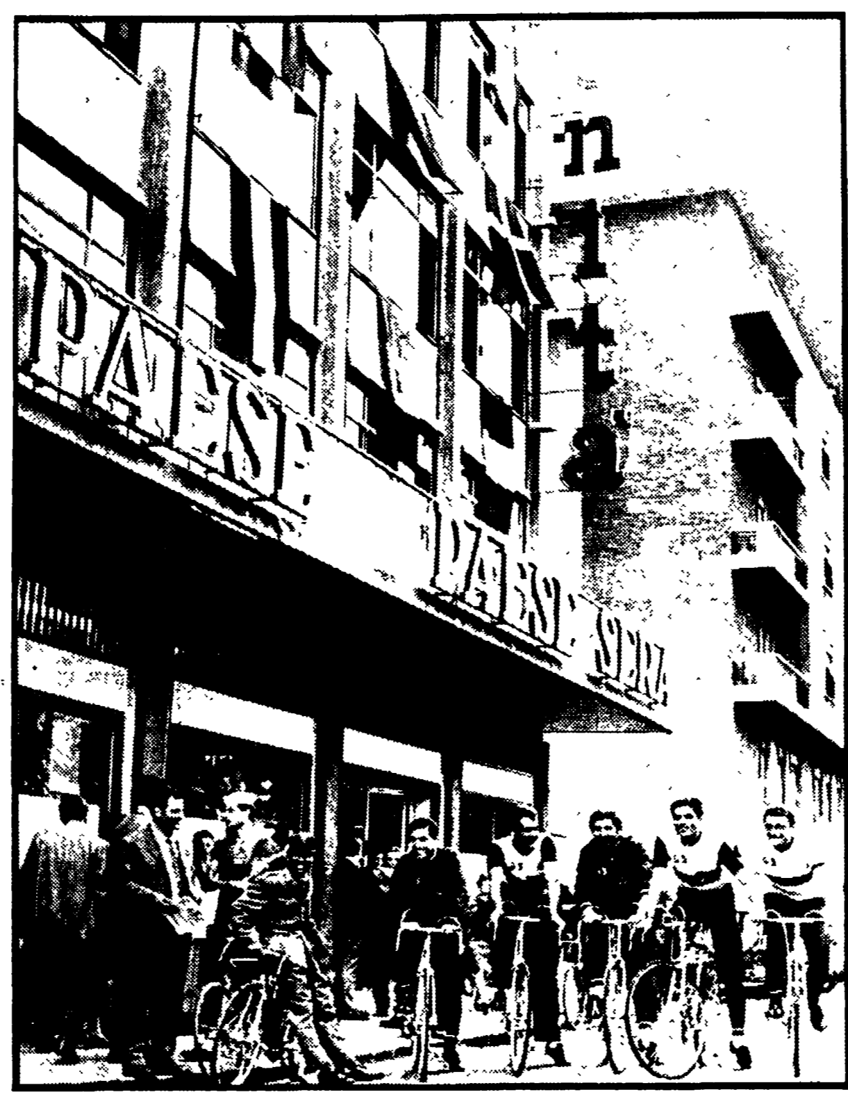
Corridori alla punzonatura davanti al Palazzo in cui si stampa «L'Unità»