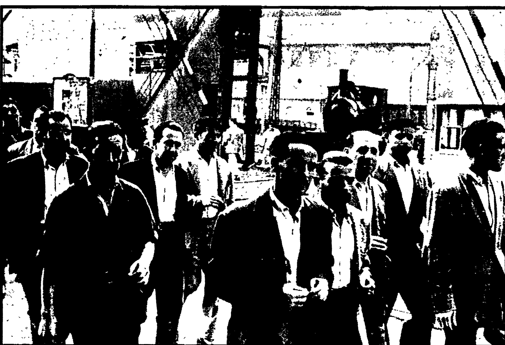
BILBAO - Un gruppo di operai spagnoli all'uscita di una fabbrica

200 mila manifesti con le direttive per il primo maggio sono stati distribuiti a Madrid - Voci su un colpo di mano dei generali azzurri