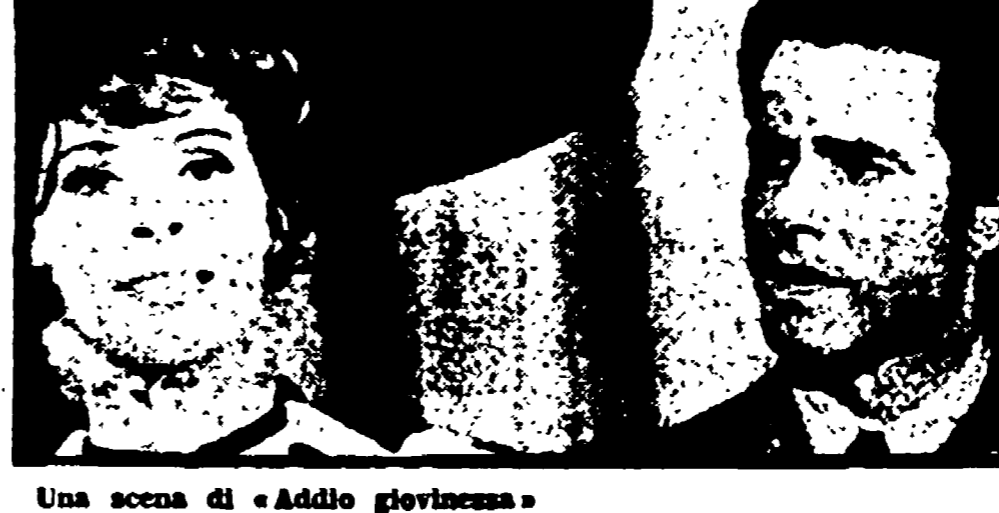
Una scena di «Addio giovinezza»